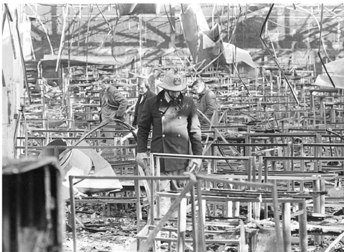
Следователи на месте пожара в дискотеке Stardust, в ходе которого 48 человек погибли и более 240 получили травмы

Да, совсем по-другому надеялись запомнить праздничную ночь гости дискотеки. Мальчики и девочки не старше 20 заплатили по три фунта за билет, дававший им право на сосиску с чипсами и танцы до двух ночи. Их было 841.