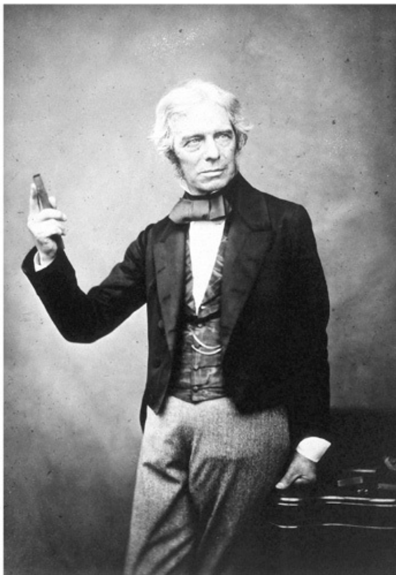
Майкл Фарадей, чья книга «Химическая история свечи» (1861) проложила путь современным исследователям пожаров

Довелось Фарадею выступать и в роли судебного эксперта, причем он брал с собой лабораторные материалы. В 1819 году владельцы сахарного завода в Уайтчепеле (район Лондона), уничтоженного пожаром, подали в суд на страховую компанию, которая отказалась выплатить 15 000 фунтов компенсации. Вопрос упирался в то, способствует ли возгоранию процесс, включающий разогретый китовый жир. Это нововведение владельцы внедрили без ведома страховщиков. Перед свидетельством в суде Фарадей провел эксперименты над китовым жиром, нагревая его до 200°C, чтобы продемонстрировать: «Все испарения жира, за исключением водных, более огнеопасны, чем сам жир. Один из присяжных не поверил ему. Тогда Фарадей поджег в сосуде одну из фракций китового жира (нафту), и «по залу суда разнесся весьма неприятный запах».