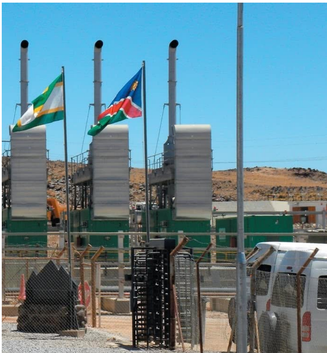
РУДНИК «ЛАНГЕР-ХАЙНРИХ» Намибия