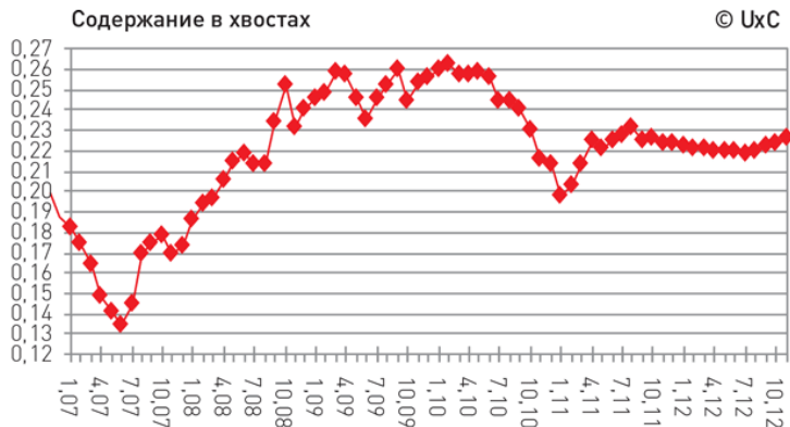
График 1. Оптимальные уровни хвостового содержания на основе спотовых цен, %

стах превышало 0,30 %. С 2003 г., когда цены на уран стали расти, содержание в хвостах начало снижение к коридору 0,20–0,25 %, а в период пика цен летом 2007 г. оно составило около 0,13 %. Оптимальные уровни содержания в хвостах последних лет, рассчитанные Ux Consulting (UxC) на основе спотовых цен, представлены в графике 1.