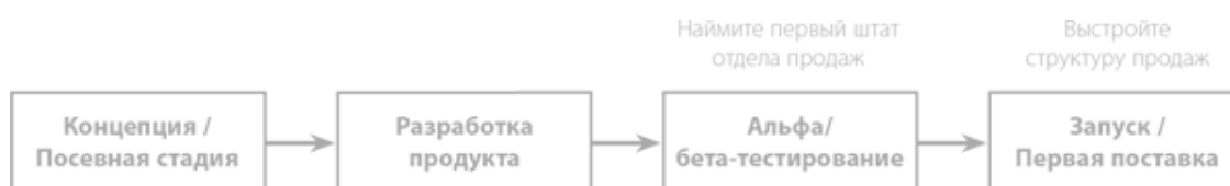
Рис. 1.2. Взгляд с точки зрения специалистов по продажам

Применять модель разработки продукта для развития потребителей – это все равно что пользоваться часами, чтобы узнать температуру. Что-то вы измерите, но совсем не то, что хотели. Рисунок 1.2 показывает, как выглядит схема разработки продукта с точки зрения продавцов. Вице-президент по продажам смотрит на схему и говорит: «Хм. Если бета-тест назначен на эту дату, не помешало бы иметь небольшую команду продавцов заранее, чтобы приобрести первых «ранних клиентов». И если дата выпуска первой версии продукта вот в этот день, то мне нужно нанять и укомплектовать департамент продаж к этому времени». Почему? «Ну, потому что план поступлений, согласованный с инвестором, предусматривает начало поступлений от продаж с момента получения первой версии продукта потребителем».