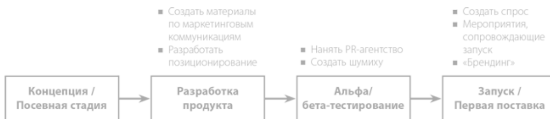
Рис. 1.3. Взгляд с точки зрения маркетологов

Руководитель отдела маркетинга смотрит на ту же диаграмму разработки продукта и видит нечто совершенно другое (рис. 1.3). Для отдела маркетинга дата начала продаж означает обеспечение постоянного притока потенциальных клиентов в воронку продаж. Чтобы разогреть спрос на продукт к моменту поставки потребителю первой версии продукта, отдел маркетинга должен подключиться на ранних этапах процесса разработки. Пока разработчики трудятся над созданием продукта, отдел маркетинга приступает к созданию корпоративных презентаций и рекламных материалов. В этих материалах подразумевается «позиционирование» компании и продукта. В преддверии запуска маркетинговая группа нанимает PR-агентство для оттачивания позиционирования и начала генерации раннего «ажиотажа» по поводу компании. PR-агентство помогает компании понять запросы ключевых аналитиков отрасли, известных людей и референтных групп и повлиять на них. Все это выливается в ряд медийных мероприятий и интервью, приуроченных к дате запуска продукта. Во времена интернет-пузыря еще одной функцией отдела маркетинга была «покупка» лояльности клиентов за счет огромных расходов на рекламу и продвижение продукта для создания бренда.