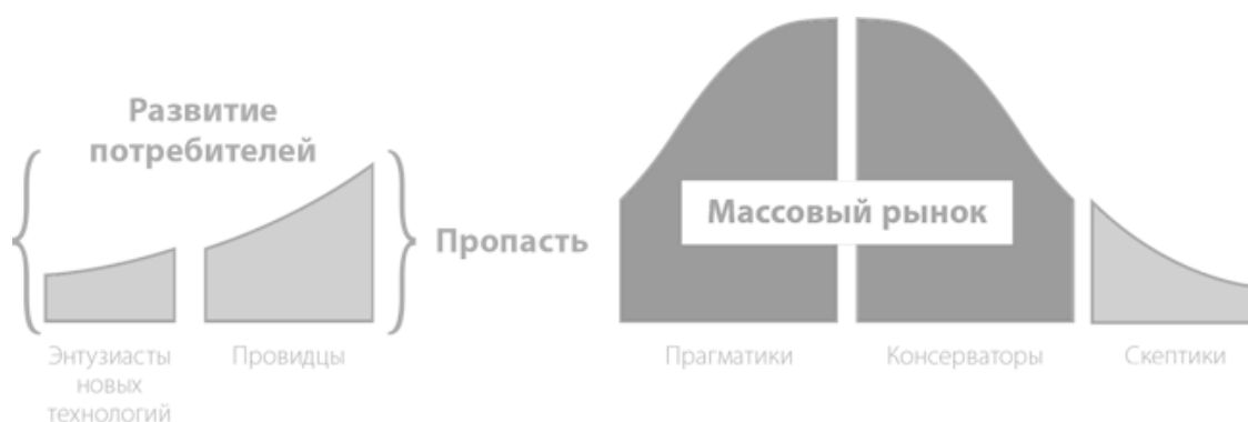
Рис. 1.4. Кривая жизненного цикла принятия новых технологий

Кривая жизненного цикла принятия новых технологий (см. рис. 1.4) была разработана Эвереттом Роджерсом, а популяризирована и дополнена понятием «пропасть» Джеффом Муром. Она предлагает предпринимателям пять идей для размышлений.