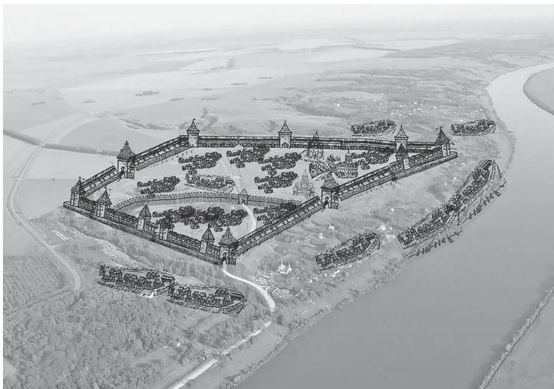
Городище Старая Рязань. Здесь возвышалась некогда великокняжеская столица Рязань, принявшая на себя в 1237 г. страшный удар Батыевой Орды

Великий князь Рязанский Юрий Игоревич послал сына своего Феодора к Батыею. Дары были приняты, а молодой князь убит. Князья, твердо решившись на борьбу с варварами, со слезами молились в соборном храме Бориса и Глеба и, получив благословение епископа Евфросина Святогорца, попрощались с семейством и народом и оставили Рязань.