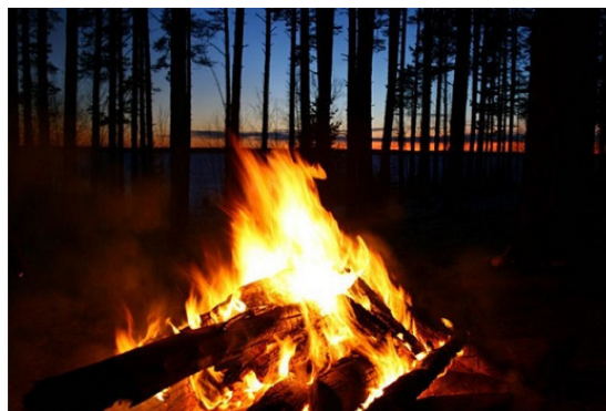
Костер в тайге