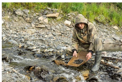
Лоток для отмывки шлихов