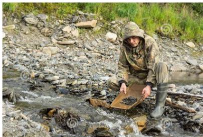
Лоток для отмывки шлихов