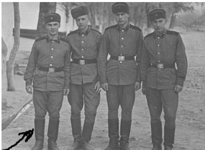
Мое отделение (ребята-минчане)