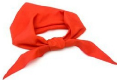
Шелковый пионерский галстук

Я и пионером-то был никаким... Мама моя тогда в универмаге работала и выбрала для меня великолепный шелковый красный пионерский галстук.