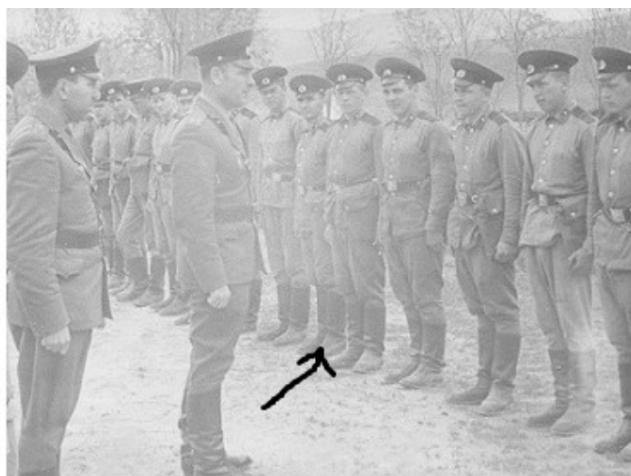
На плацу. Построение.