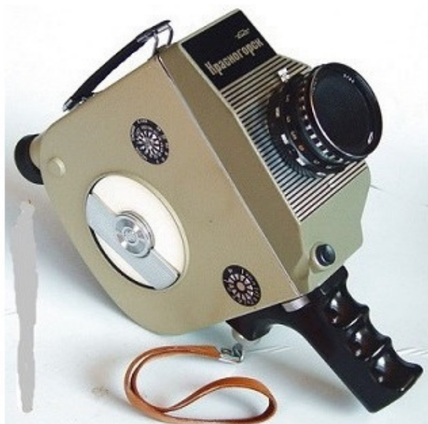
Любительская пленочная кинокамера

Он забрал их и просмотрел. Вечером вернул и сказал, что держать лишнее не положено. И я отправил кассеты домой. но скоро случился какой-то праздник, на котором наша «учебка» должна была промаршировать по центральной части города, показывая выучку, боевой дух и слаженность – в честь знаменательной даты.