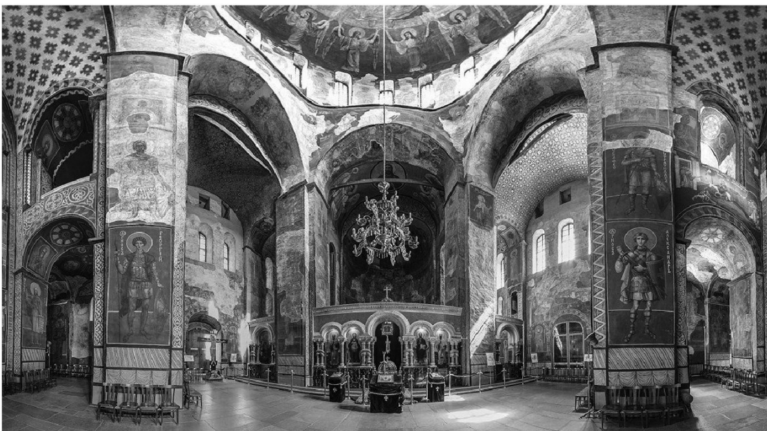
Панорамный вид интерьера Кирилловской церкви. Киев