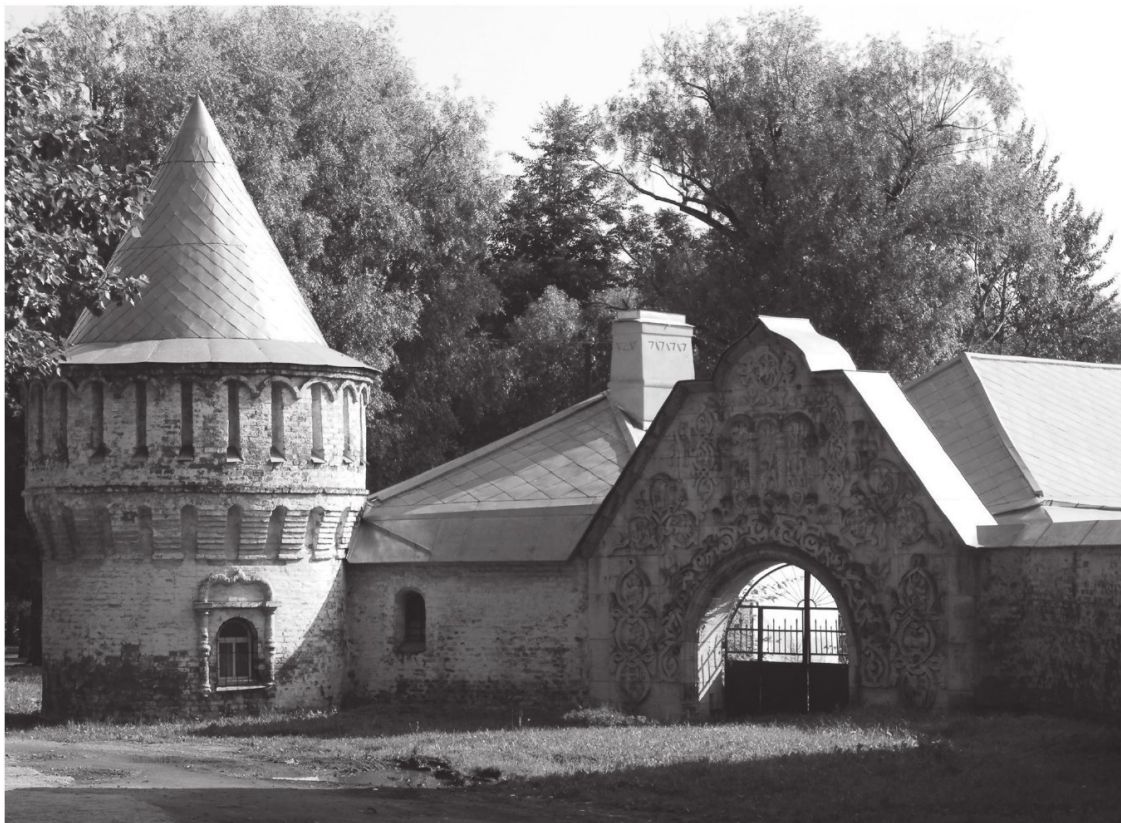
Федоровский городок. Ленинград