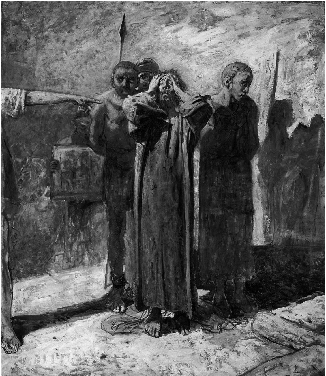
Голгофа. Художник Н. Н. Ге

Борис видел, что разница между ним и всеми людьми была в том, что он, не будучи смертельно болен, как Иван Ильич, тем не менее видел смерть, как и тот, за всеми делами и вещами. Их обман не скрывал ее от него. Умирающий Иван Ильич плакал о своем одиночестве, жестокости людей и Бога, об отсутствии Бога. Живой и здоровый, но знающий о своей смертности Борис тоже искал, за что бы уцепиться на краю невидимой другими, но прозреваемой им бездны. И потому Борис был несчастнее Ивана Ильича, в смерти освободившегося от ее страха.