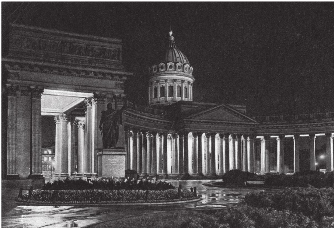
Казанский собор. Ленинград