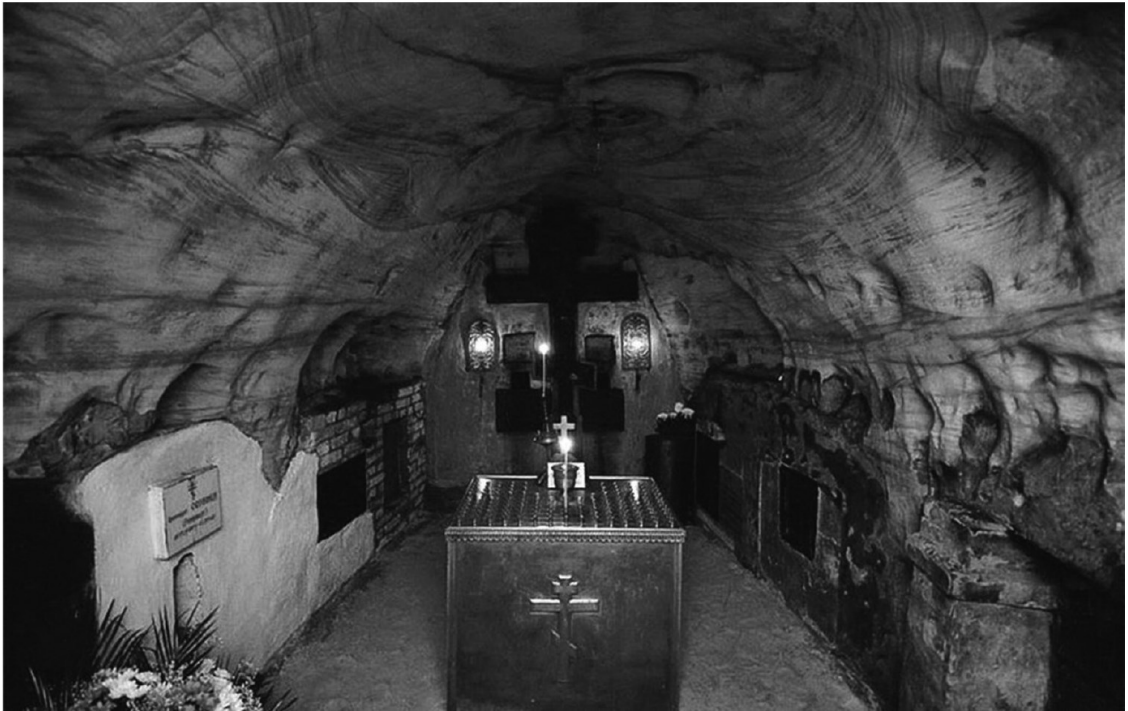
В Богом зданных пещерах монастыря