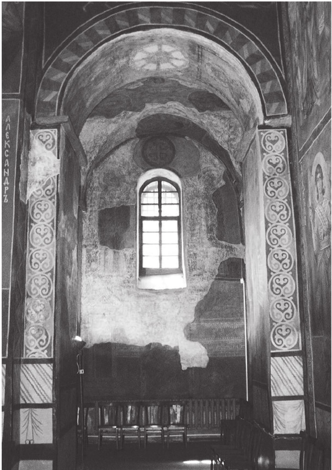
Кирилловская церковь, XII век. Киев. Вид на ктиторскую композицию и на изображения святых над нею