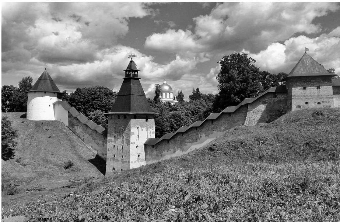
Стены и башни Псково-Печёрского монастыря