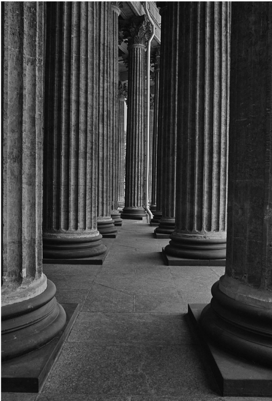
Колоннада Казанского собора

Рядом красовался Казанский собор со знаменитым изогнутым портиком. Они прошли в сквер, отделявший его от Невского проспекта. Когда-то здесь у портика произошло решающее объяснение Блока и Менделеевой. В кармане юного Александра лежал револьвер, выстрелом