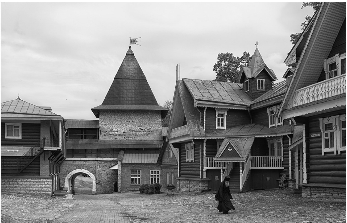
Хозяйственный двор Псково-Печерского монастыря