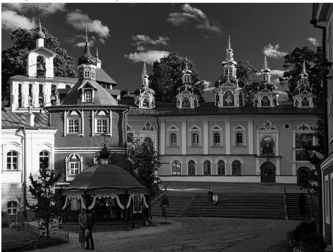
Соборная площадь монастыря