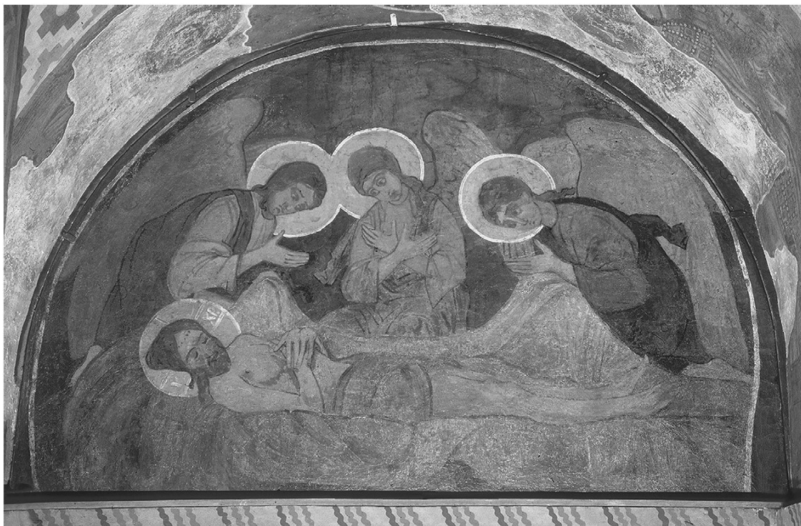
Надгробный плач. М. А. Врубель, 1884 г. Кирилловская церковь. Киев