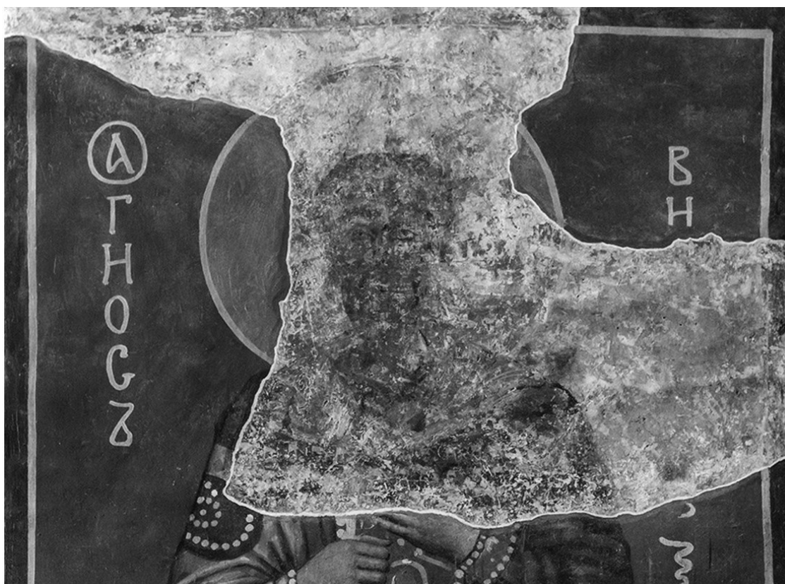
Неизвестный святой. Фреска, XII век. Кирилловская церковь. Киев

– Посмотрите, пожалуйста, сюда. Здесь мы с вами можем рассмотреть фрагменты фресковой композиции двенадцатого века. В центре композиции – крупная фигура; сохранилось изображение ее головы с крещатым нимбом и распростерты над кем-то руки. Судя по крещатому нимбу, изображен на фреске Иисус Христос. Под распростертыми руками справа заметен фрагмент нимба и верхняя часть головы, слева – часть руки, что-то подающей Иисусу, – вероятно, макет Кирилловской церкви. Несмотря на плохую сохранность, эти малочисленные фрагменты подсказывают нам, что перед нами ктиторская композиция: Иисус Христос с предстоящими. Трудно судить о том, кого благословляет Христос и кто подносит Ему макет собора. Единственно, что можно утверждать, – что это изображение двух святых. А теперь перейдем к следующей фреске.