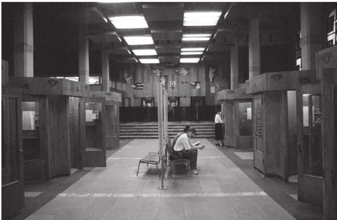
Телефонный переговорный пункт в бывшем храме Успения Богородицы на Успенском вражке (советские годы)