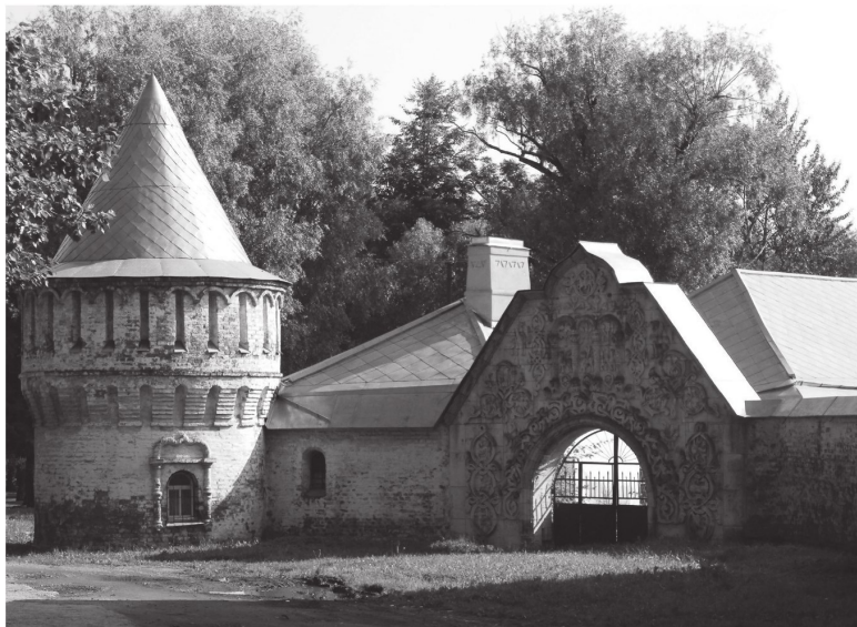
Федоровский городок. Ленинград