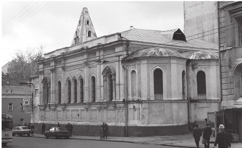
Храм Успения Богородицы на Успенском вражке в Москве рядом с Центральным телеграфом (советские годы)