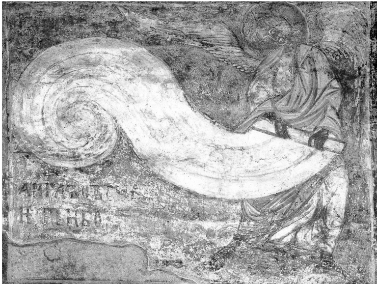
Ангел, свивающий небо в свиток. Фреска, XII век. Кирилловская церковь. Киев