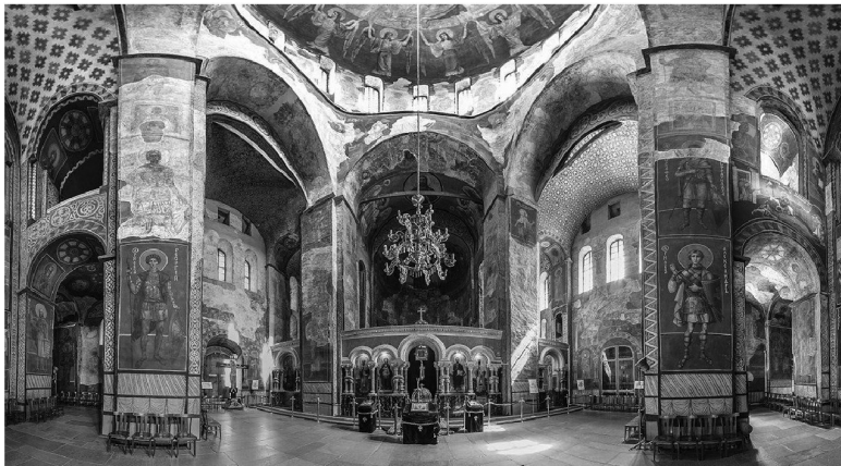
Панорамный вид интерьера Кирилловской церкви. Киев