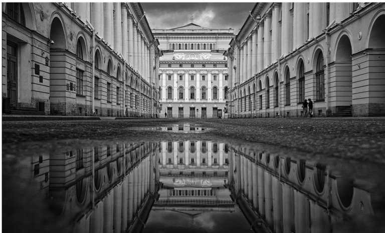
Улица Зодчего Росси. Ленинград