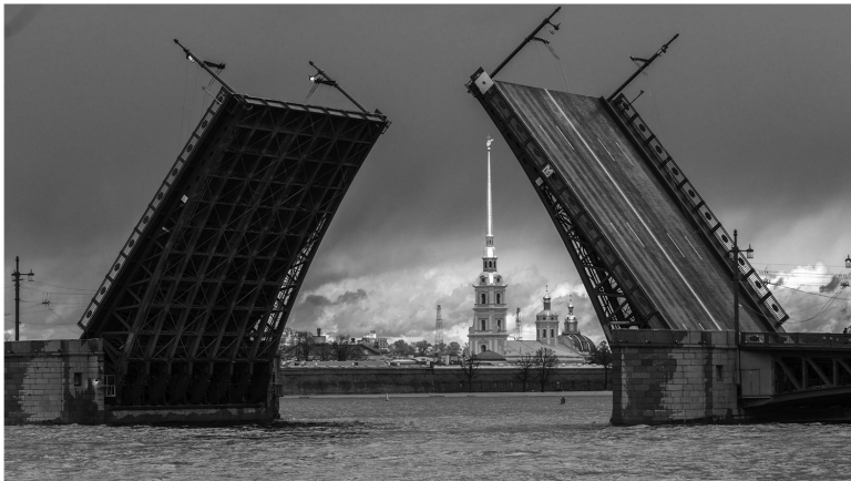
Разведенный Дворцовый мост. Ленинград