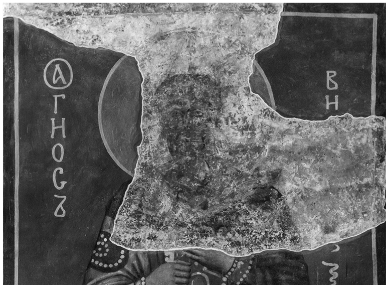
Неизвестный святой. Фреска, XII век. Кирилловская церковь. Киев

слева – часть руки, что-то подающей Иисусу, – вероятно, макет Кирилловской церкви. Несмотря на плохую сохранность, эти малочисленные фрагменты подсказывают нам, что перед нами ктиторская композиция: Иисус Христос с предстоящими. Трудно судить о том, кого благословляет Христос и кто подносит Ему макет собора. Единственно, что можно утверждать, – что это изображение двух святых. А теперь перейдем к следующей фреске.