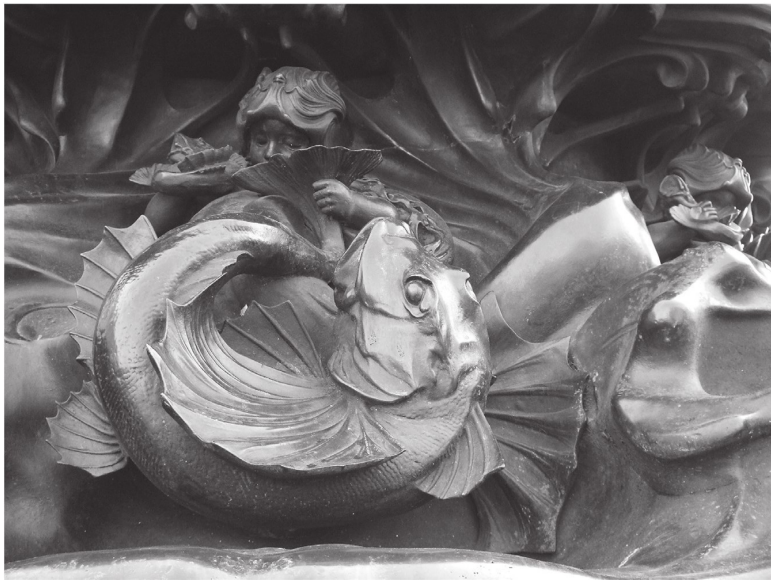
Альберт Гилберт: Эрот. Внизу: деталь основания

Изображения явно занимают странное промежуточное положение между речевыми высказываниями, чье назначение – нести смысл, и порождениями природы, которые лишь мы способны наделить смыслом. При открытии фонтана на Пикадилли один оратор назвал его «самым подходящим памятником лорду Шефтсбери, который всегда давал воду равно богатым и бедным». Это – простое, даже банальное сравнение, никто не выведет из него, что фонтан означает благотворительность, не говоря уж о том, что раздача воды бога-