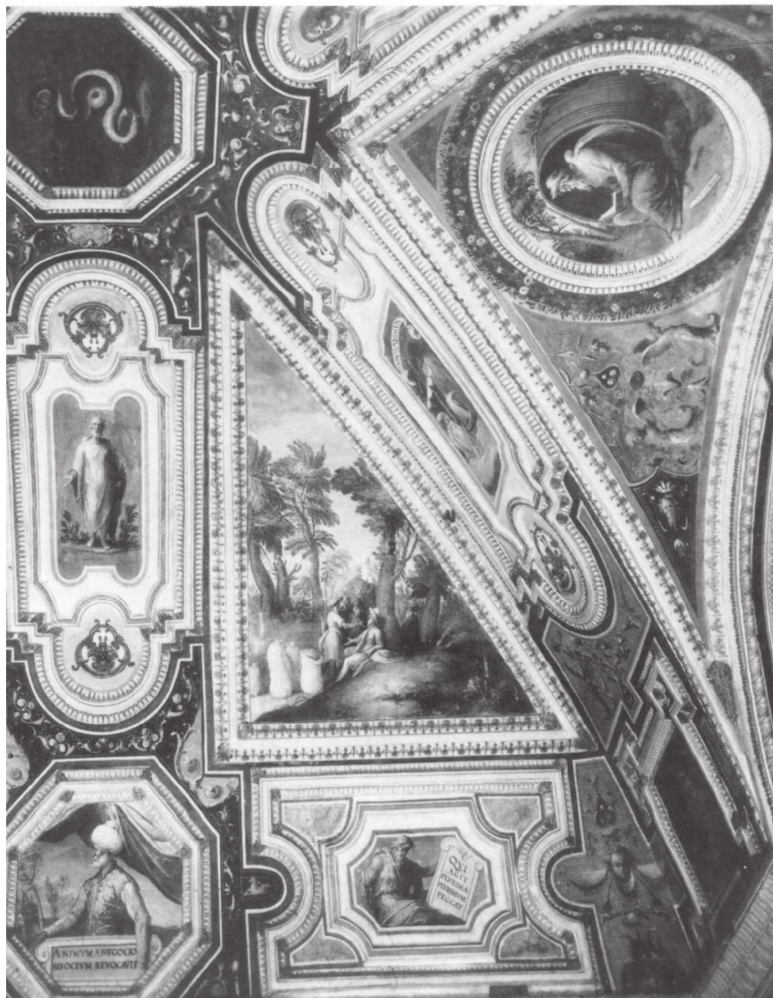
Таддео Цуккарро: Гипербореи; вверху: Диоген; внизу: Су-