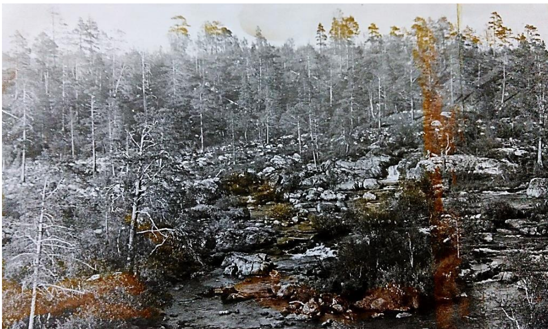
Река Средняя на 14-м километре от города. Место нашей переправы

Высаживаемся на остановке у сопки Пупок. Это место замечательно тем, что можно довольно просто перебрести реку Большую Среднюю по сравнительно мелкому перекату. Однако теперь, стоя на берегу и наблюдая бешеное течение вспученной воды, нам что-то не хочется рисковать, тем более, что придётся тащить Вегу на плечах. Решаем переправиться чуть выше, там, где река распадается на несколько потоков, умеряя своё бешеное течение среди каменистых островков.