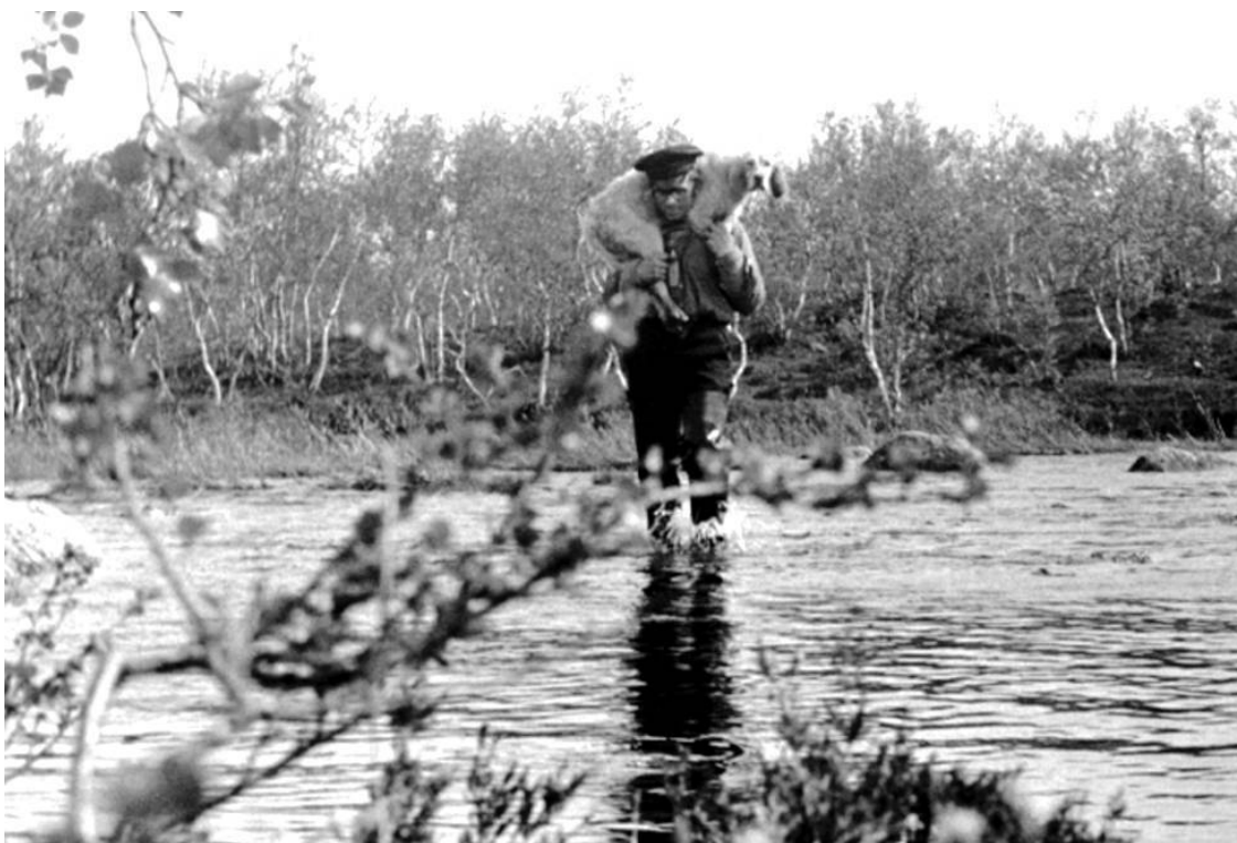
Воспоминания о Веге...

Наша семья тяжело переживает уход Веги. Не хватает её умного, всё понимающего взгляда, привычного подсовывания головы под руку, прогулок по городу и парку, замечательных охот... Однако заполнить душевную пустоту только воспоминаниями невозможно: тоска по любимой собаке набирает силу, служба не радует, работа валится из рук, мне постоянно снятся сны про наши с Вегой охоты, где собака снова бежит рядом по осенним сопкам, и снова я взваливаю её на плечи, перенося через очередную водную преграду.