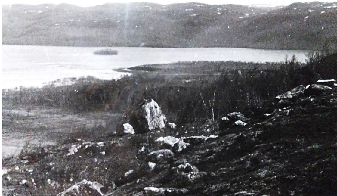
Озеро Домашнее. Видно устье реки Средней и остров