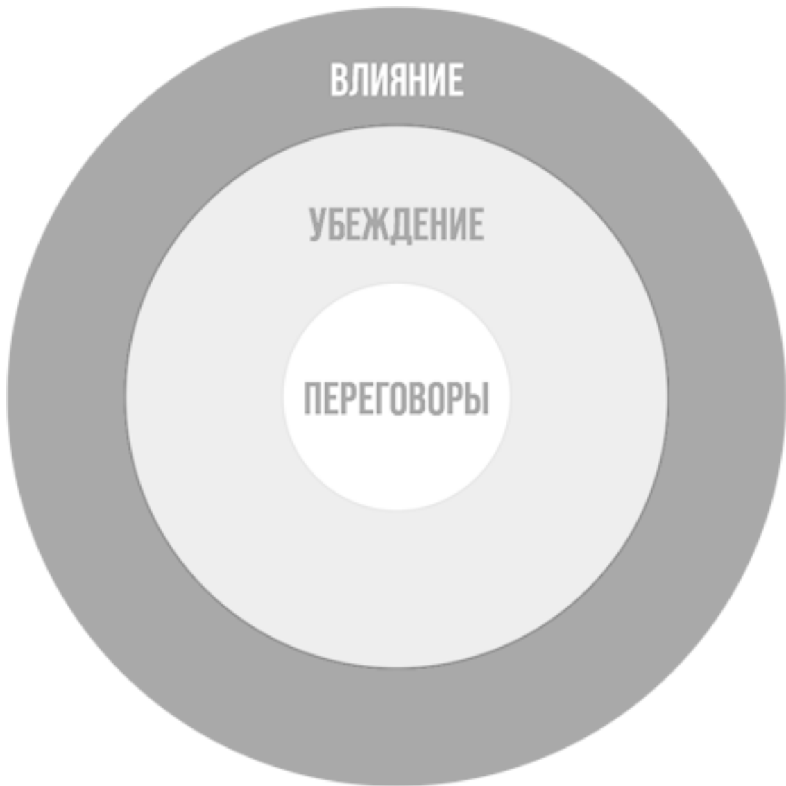
Рис. 1.1. Набор инструментов переговорщика

Внешний круг на рис. 1.1 – это влияние, то есть повсеместно встречающийся фактор. Проявляющийся в вербальной и в невербальной форме, он содержит все то, что определяет, как другие люди реагируют на вас. Чтобы уяснить, каким образом этот фактор соотносится с двумя другими кругами диаграммы, представьте себя на встрече, цель которой – настроить клиента на участие в каком-то новом бизнесе. В тот момент, когда вы вошли в дверь, возникает фактор, определяющий степень вашего влияния. Например, в случае опоздания у вас – если вы не извинитесь и не объясните причину задержки – не получится эффективно воздействовать на ход заседания.