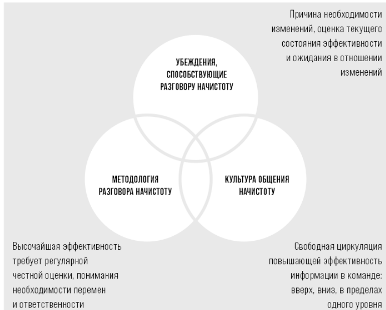
РИСУНОК 1. Что такое разговор начистоту?