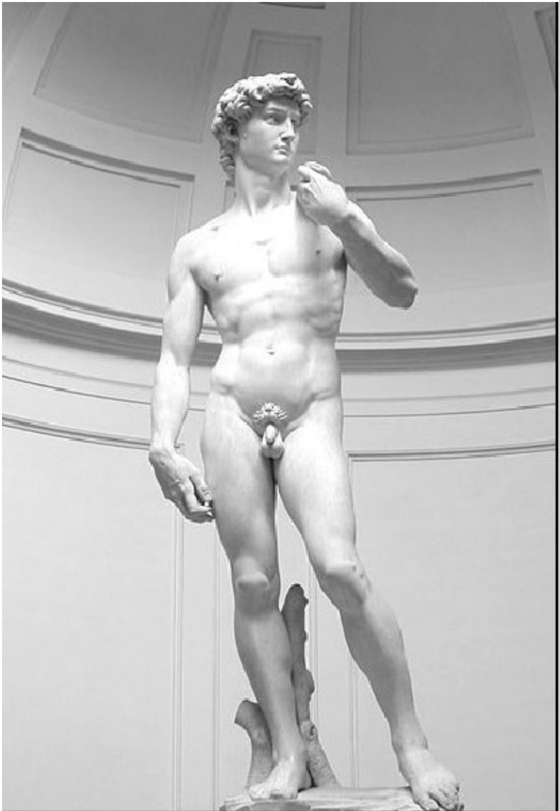
Давид. Микеланджело, 1504 г.

Мраморная статуя Давида высотой 5 м 17 см работы Микеланджело изображает обнаженного юношу, готовящегося к бою с Голиафом. Оригинал статуи находится в Академии изящных искусств во Флоренции.