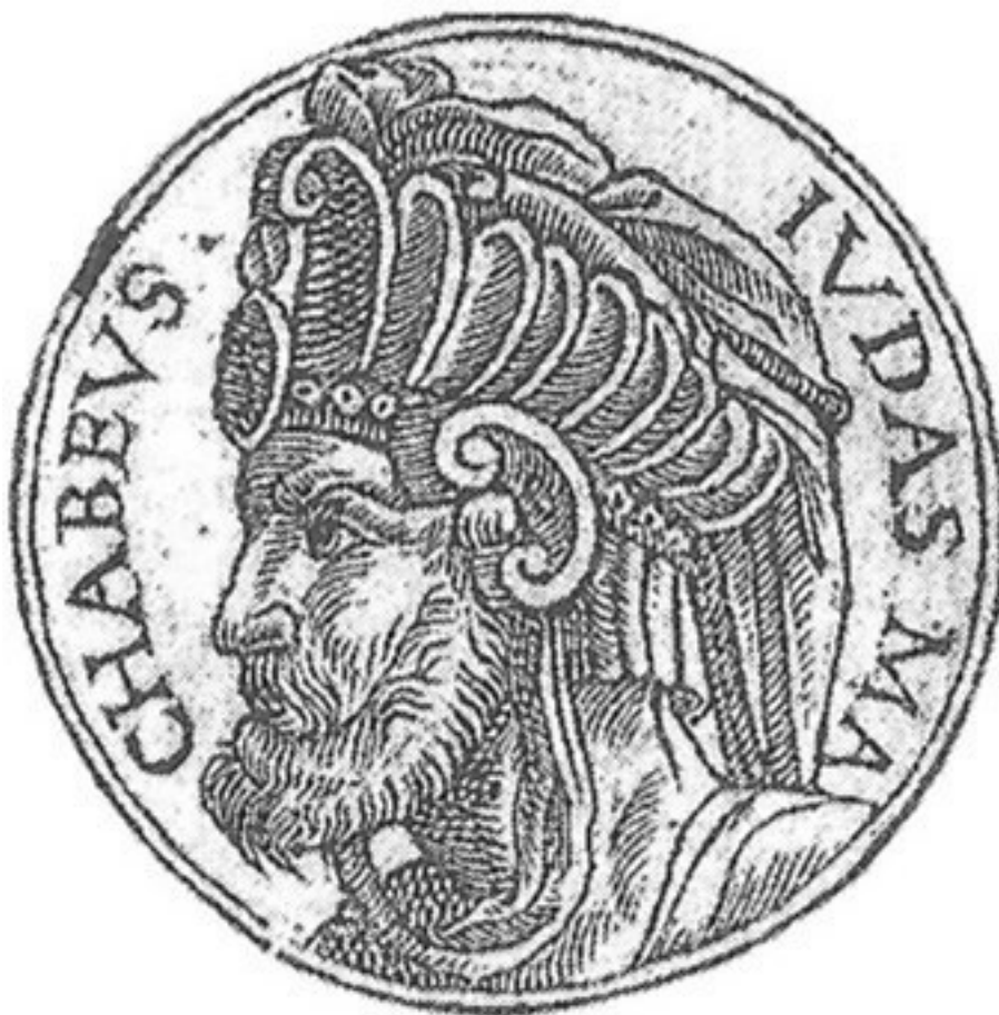
Изображение Иегуды Маккавея

В итоге освободительной войны в 164 г. до н.э. евреи освободили Иерусалим и очистили свой Храм от языческих идолов. У евреев этому событию посвящен праздник Ханука.