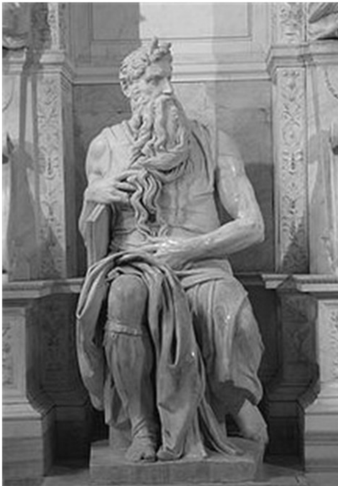
Моисей. Микеланджело, 1515 г.

Мраморная статуя Моисея высотой 2 м 35 см работы Микеланджело изображает колоссальную духовную силу ветхозаветного пророка. Оригинал статуи находится в базилике Сан-Пьетро-ин-Винколи, Рим.