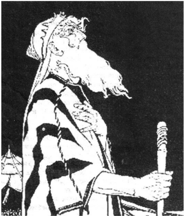
Праотец Авраам. Эфраим Лилиен