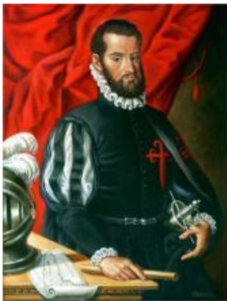
Педро де Авилес. Гравюра XVI в.

Испанцы зверски расправлялись с теми, кто осмеливался появиться в американских водах и тем более высаживаться на побережье испанской Америки. Когда, к примеру, бежавшие из Франции гугеноты образовали свое небольшое поселение во Флориде, испанский король немедленно направил туда карательный отряд под началом некоего Педро де Авилеса. Все население, включая женщин и детей, было вырезано, причем не потому, что они были французы, а потому, что протестанты.