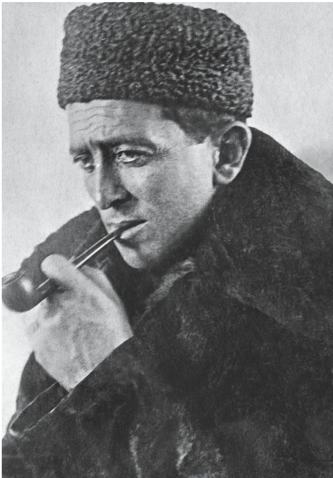
Ефим Иосифович Алешковский. После войны