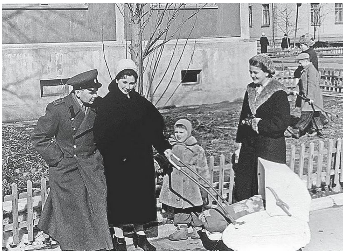
Во дворе. Март 1961