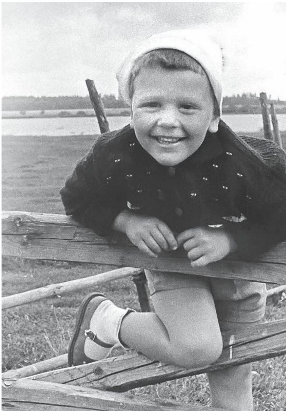
Акатово. На околице