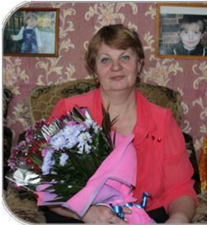
Бекрень, Тверская обл.