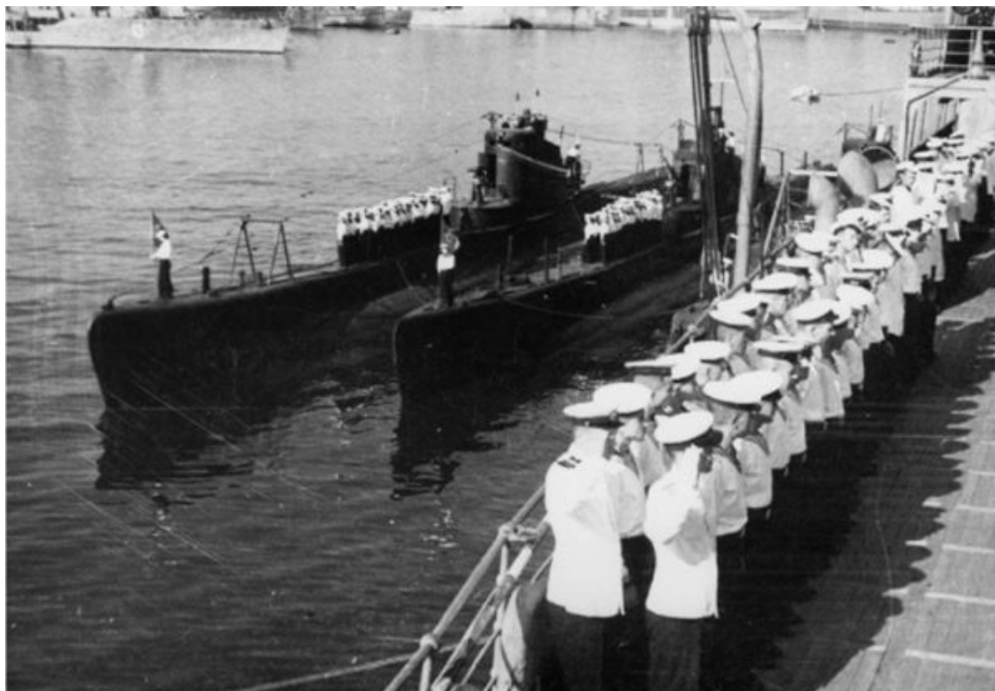
Торжественное построение экипажей подводных лодок «Щ-201» и «Щ-202»

Для меня эта ночь была первым испытанием. Я впервые видел разъярённое море во всей красоте, во всём его величии. Это незабываемое впечатление осталось на всю жизнь.