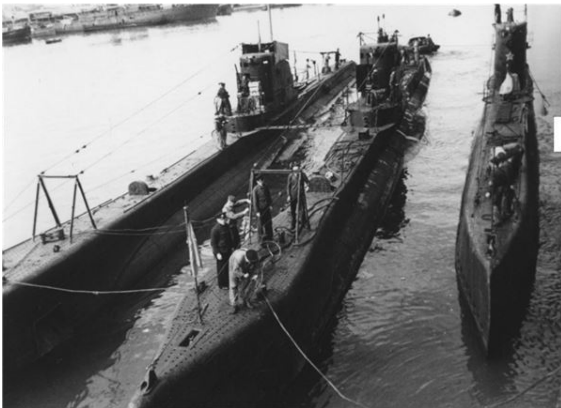
Подводные лодки «Щ-202», «Щ-203» и «Щ-216».