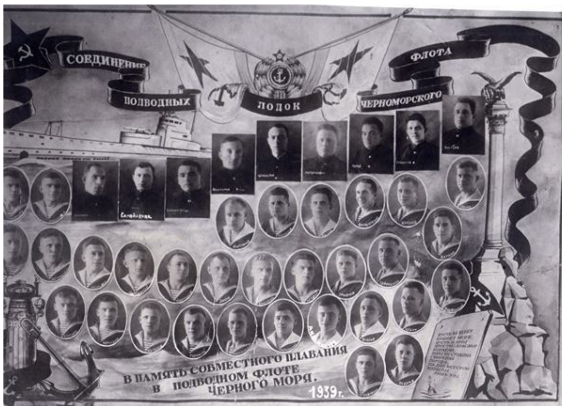
На фотоснимке сняты л.с. «Щ-202» и штаб УДПЛ.

По рядам слева направо: Первый верхний ряд: