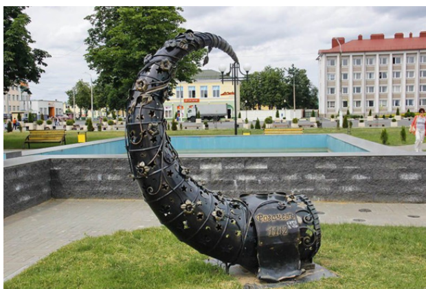
Рогачев.

Как ни твердо он был убежден в истинах, открытых ему его благодетелем, как ни радостно ему было то первое время увлечения внутренней работой самосовершенствования, которой он предался с таким жаром, после помолвки князя Андрея с Наташей и после смерти Иосифа Алексеевича, о которой он получил известие почти в то же время, – вся прелесть этой прежней жизни вдруг пропала для него. Остался один остов жизни: его дом с блестящею женой, пользовавшеюся теперь милостями одного важного лица, знакомство со всем Петербургом и служба с скучными формальностями. И эта прежняя жизнь вдруг с неожиданной мерзостью представилась Пьеру. Он перестал писать свой дневник, избегал общества братьев, стал опять ездить в клуб, стал опять много пить, опять сблизился с холостыми компаниями и начал вести такую жизнь, что графиня Елена Васильевна сочла нужным сделать ему строгое замечание. Пьер почувствовав, что она была права, и чтобы не компрометировать свою жену, уехал в Москву».