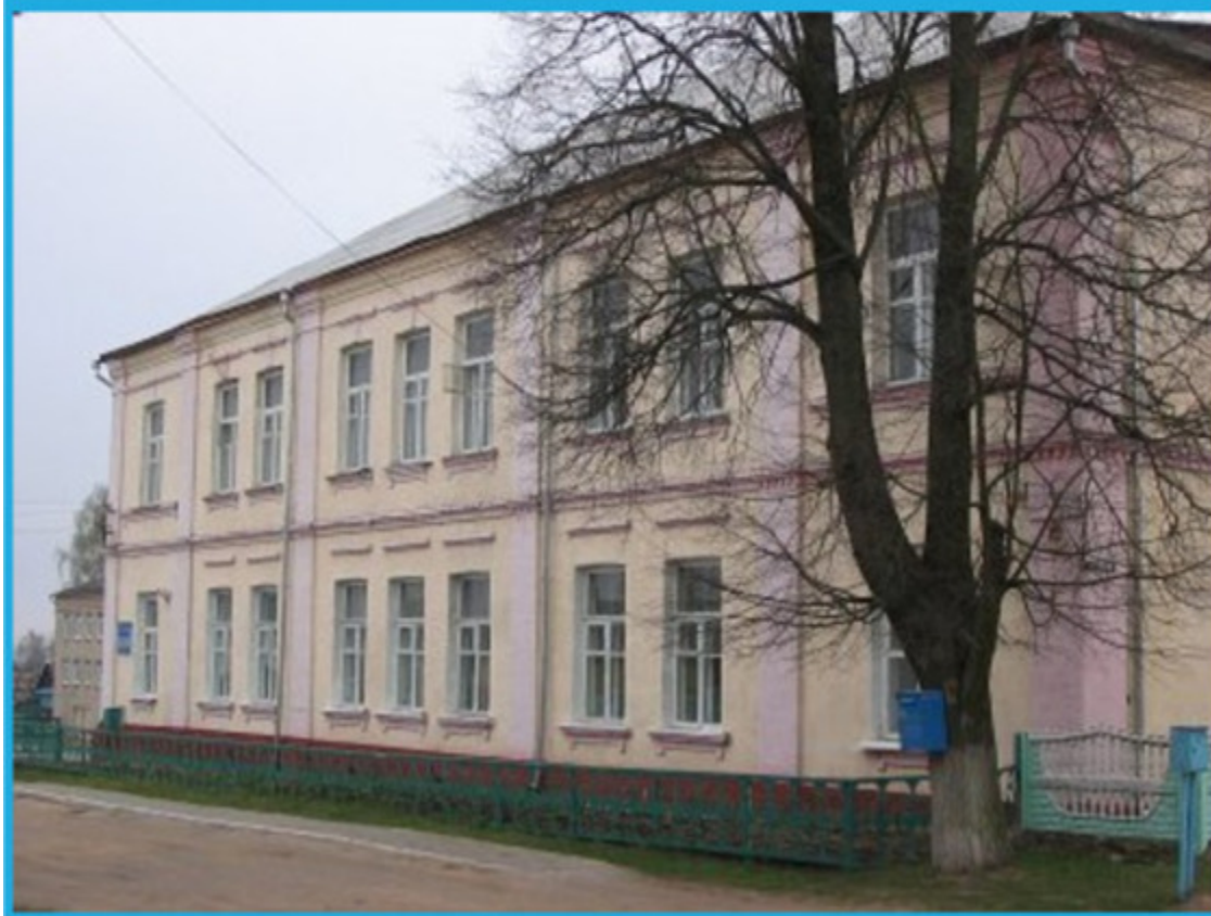
Рогачев, рядовая застройка. Андрей Дыбовский, апрель 2008 г.