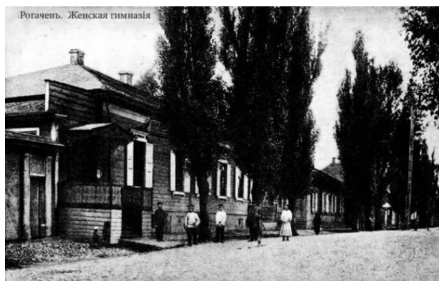
Рогачев на старой фотографии.

«По сведениям за 1866 год число жителей 6138 душ обоего пола (3177 мужского пола), из коих городских сословий: купцов 133, мещан 4811. Неправославных: раскольников 23, католиков 307, евреев 2537. Церквей православных 1 (деревянная), костел католический 1 (деревянный), еврейская синагога 1, молитвенных школ 4, обывательских домов 354 (2 каменных), лавок 84, аптека, почтовая станция, дворянское уездное 5-ти классное училище, приходское одноклассное училище, казенное еврейское училище 1-го разряда, частный женский пансион. Город имеет во владении 2.733 десятины земли;