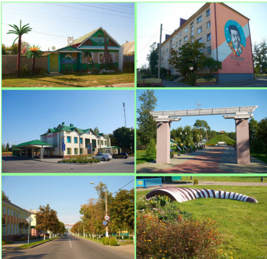
Рогачев в наши дни. Рогачев.