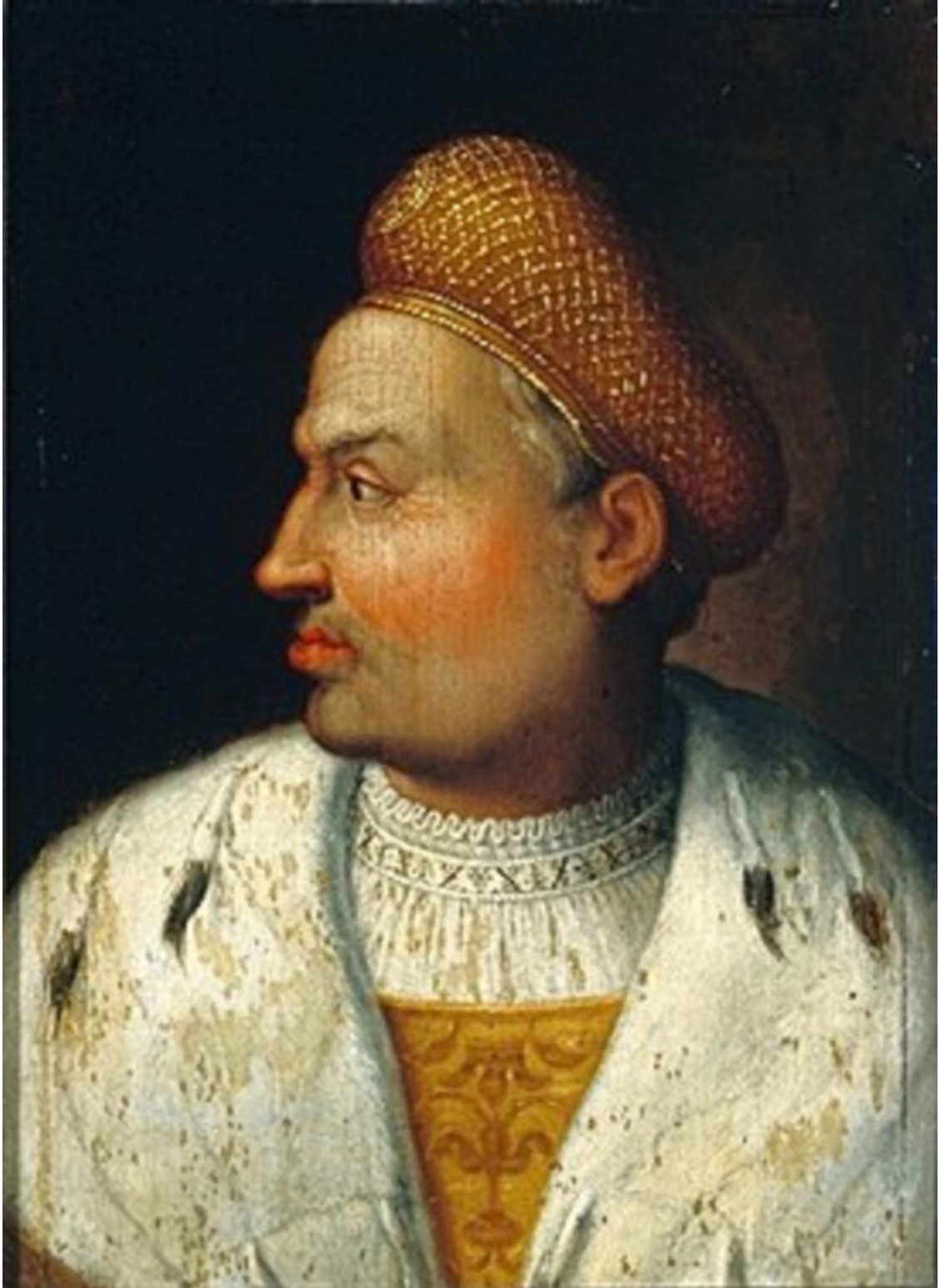
«Сигизмунд I Стáрый (лит. Žygimantas Senasis, польск. Zygmunt I Stary; 1 января 1467, Краков, Польша – 1 апреля 1548, там же) – великий князь литовский с 20 октября 1506 (про-

Конец тринадцатого столетия. С данного времени город был составной частью Великого Княжества Литовского, великокняжеским владением. К его концу имел место его переход во владение князя Довмонта.