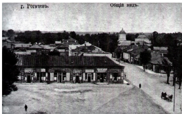
Рогачев на старой фотографии.