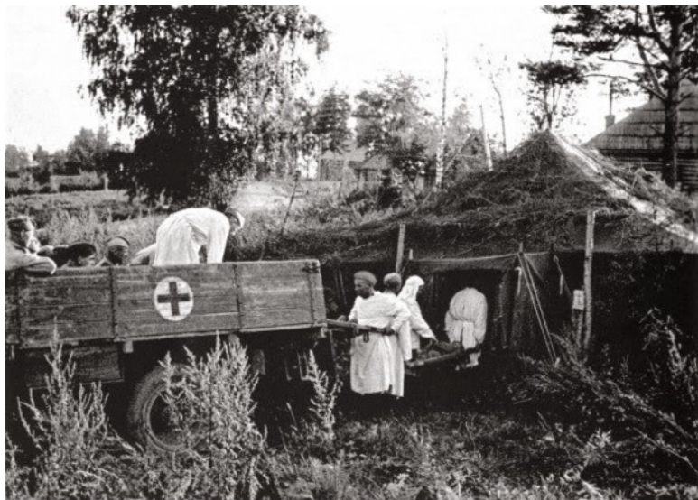
Доставка раненых на грузовике ЗИС-5 в полевой госпиталь

А жизнь становилась всё суровее. В лавке исчезли продукты. По деревням стали ходить старшие школьники и читать колхозникам инструкции по распознаванию иприта и люизита, а также фосгена и дифосгена. Оказывается, фосген пахнет миндалем. Поскольку в деревнях миндаля в глаза не видели, то все эти читки были для галочки.