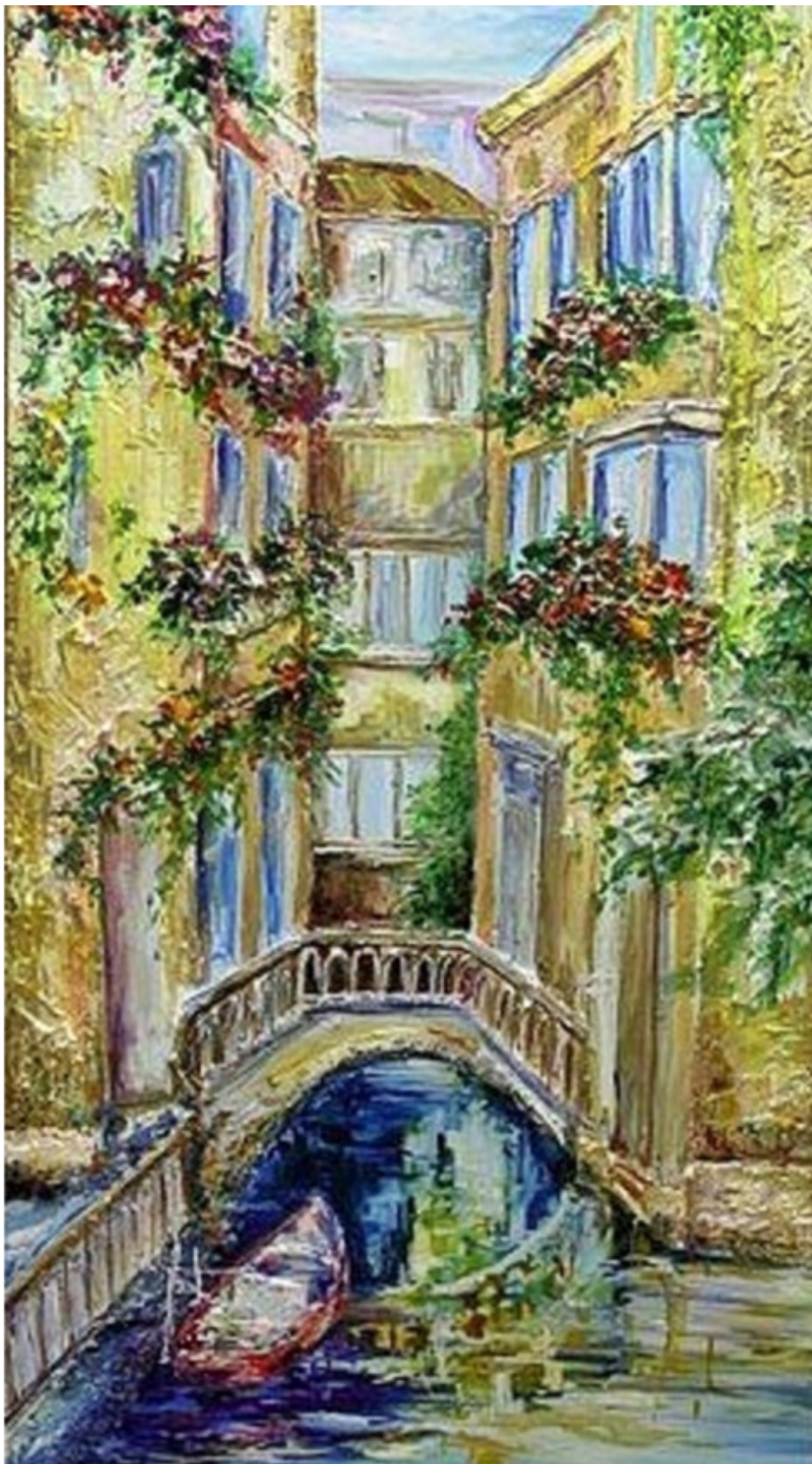
Живопись Ирины Овсянниковой