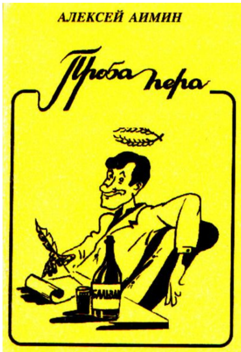
Обложка первого издания