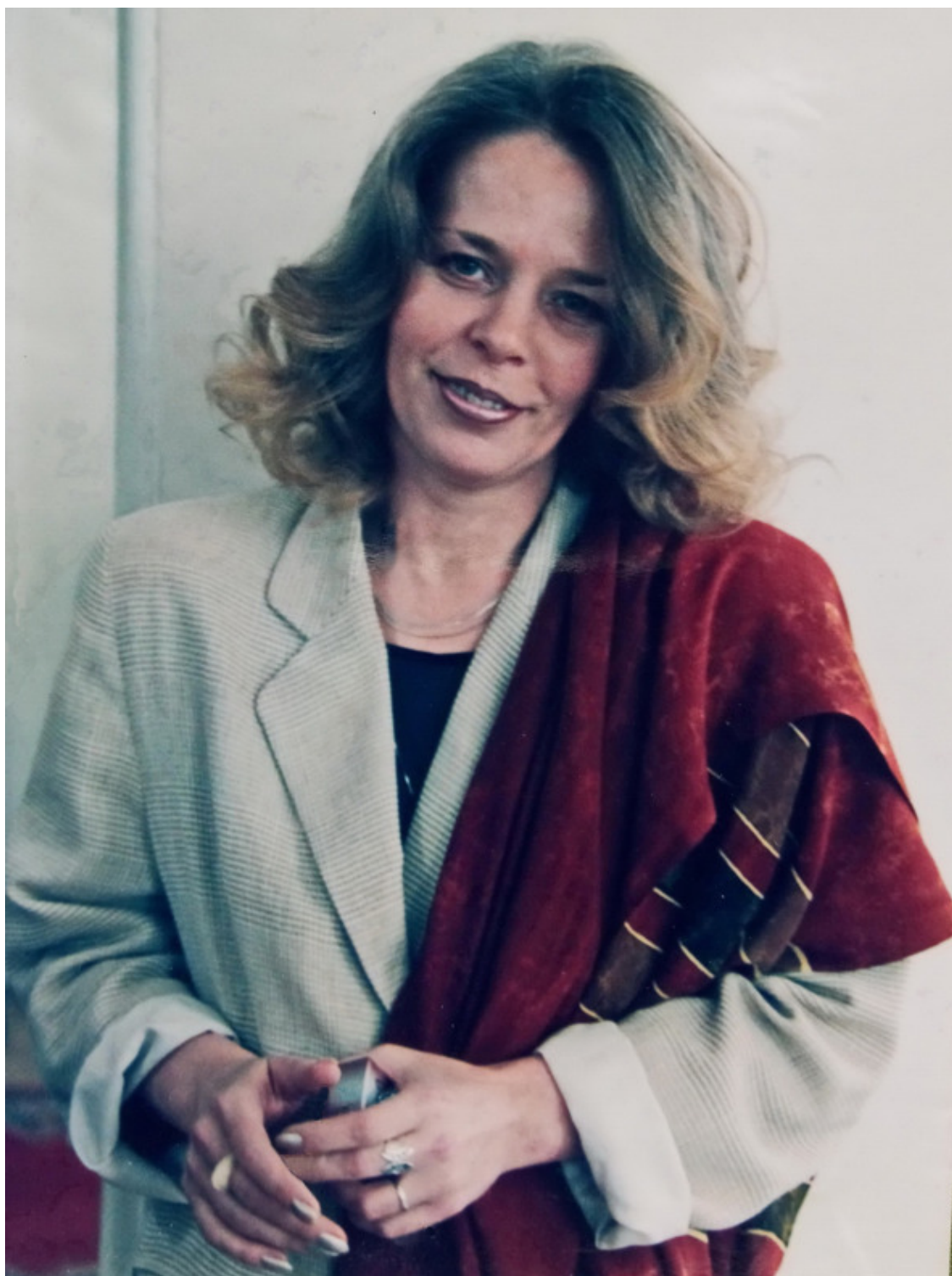
Автор времён работы в оркестре