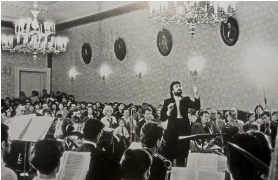
Один из первых концертов в Актовом зале КГУ

невековые менестрели, шагнувшие из глубины веков, материализовавшись как бы из воздуха, протянули музыкальную нить Ариадны, соединив пространство и время.