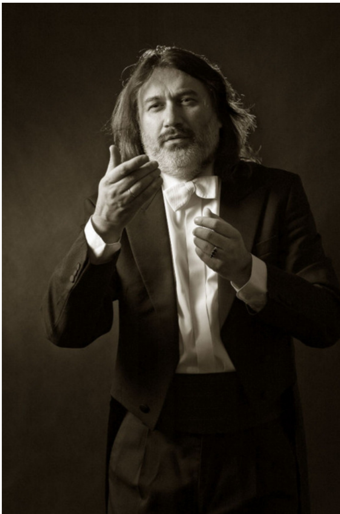
Дирижирует маэстро Рустем Абязов