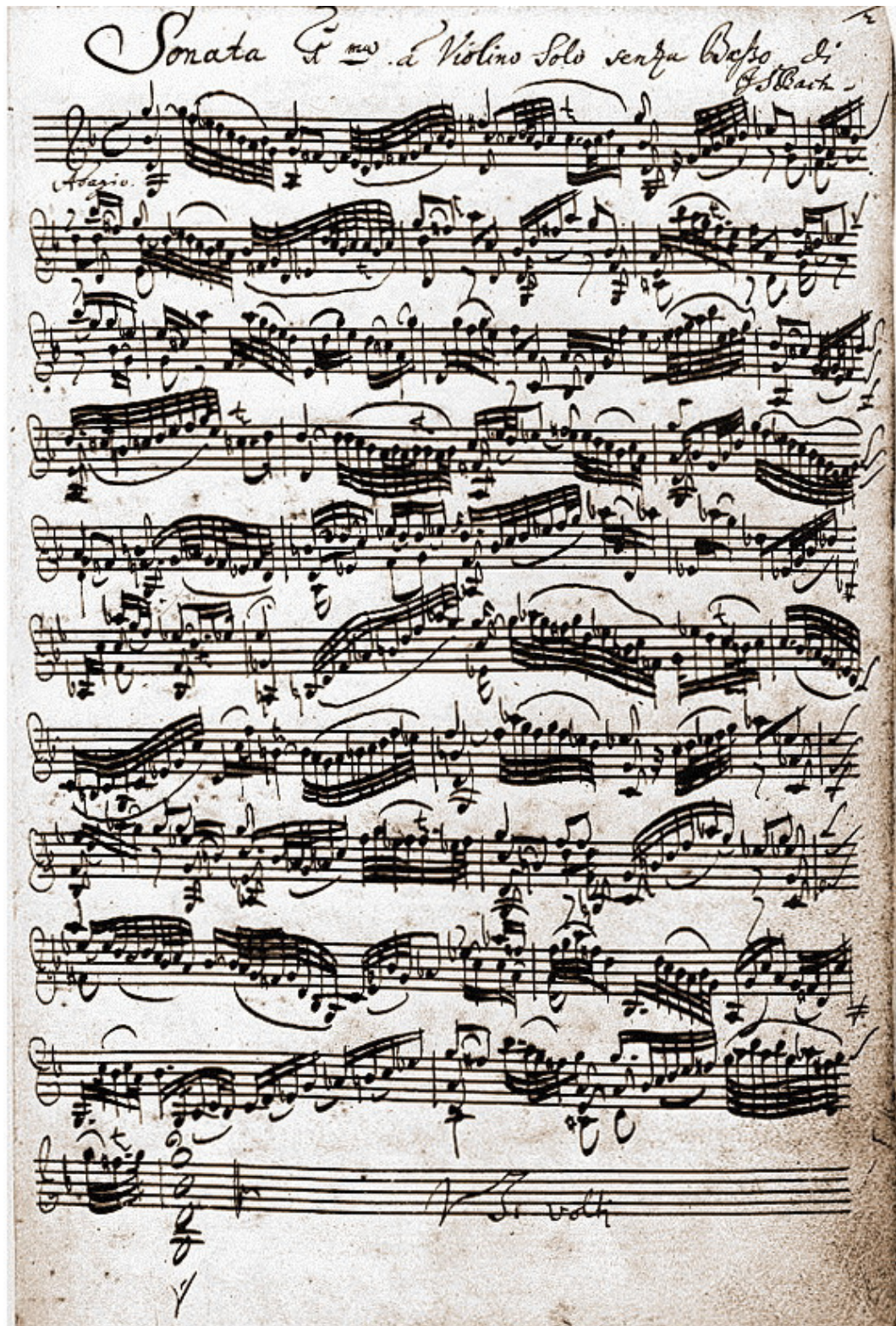
Соната для скрипки соль минор, написанная рукой Иоганна Себастьяна Баха