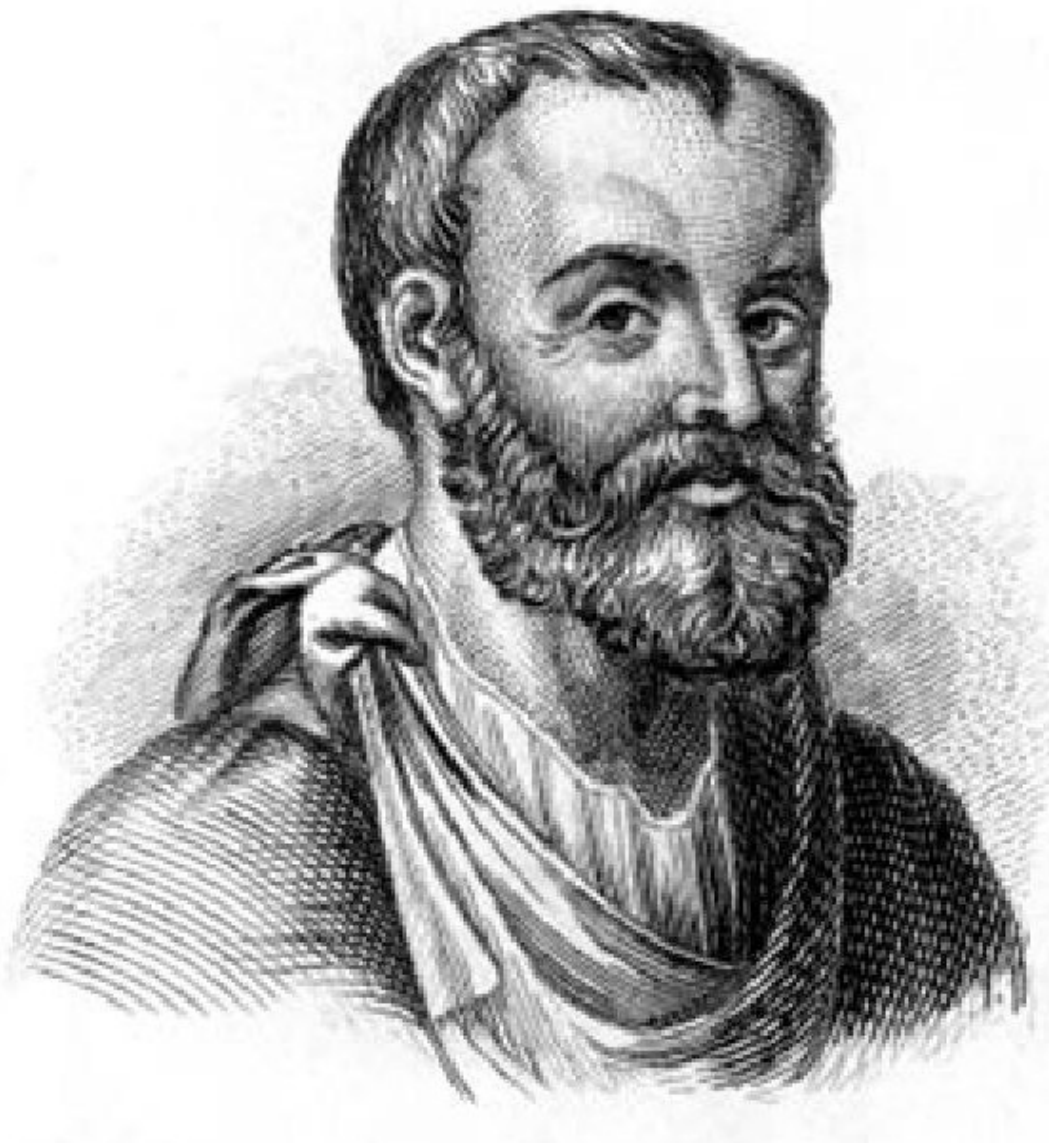
Портрет Клавдия Галена

Я бы хотел отметить еще одного известного ученого и медика, который жил во II – III столетии н. э. в Древнем Риме – Клавдия Галена. Его уже тогда называли хирургом.