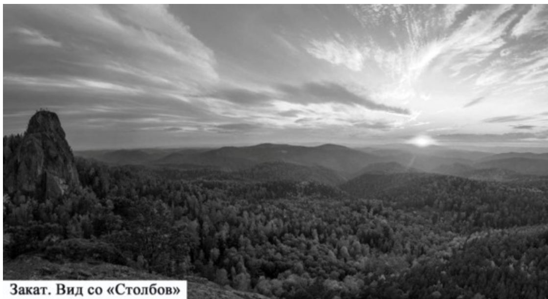
Закат. Вид со «Столбов»