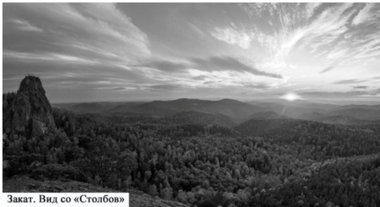
Закат. Вид со «Столбов»

ский поехал за теплыми вещами в общежитие, он был взят прямо в комнате и завербован проводником. В третью ночь я был передан в руки родителей и вывезен в Ужур. До начала новой жизни оставалось полтора месяца.