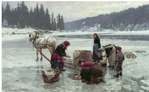
Норвежский художник Ян Экенес «Женщины стирают» 1891 год.