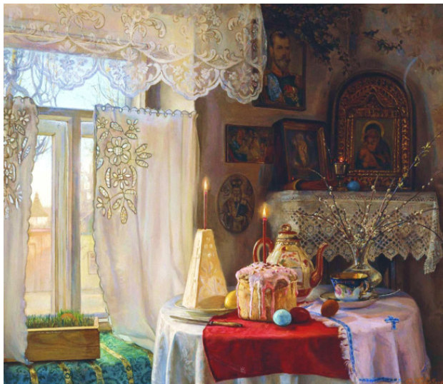
И. А. Каверзнев «Светлое Воскресение» 1962 г.р.

Вот и стала Дарья Ивановна жить в семье Ивана Сергеевича. Живет, утешается. С Евдокией Семеновной и с Полюшкой общается. А Полюшка как увидела ее в первый раз, так засветилась вся от счастья и воскликнула: «Бабушка, бабушка к нам пришла, Дарья Ивановна!»