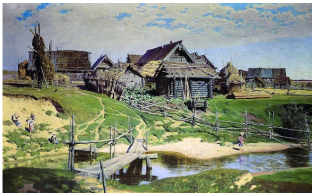
Василий Дмитриевич Polenov «Русская деревня» 1889г.

... – Мир дому сему! С праздником, Дарья Ивановна! – сказал Иван Сергеевич, заходя в избу старой женщины. – Вот возьмите от меня вербочки – в церкви освященные.