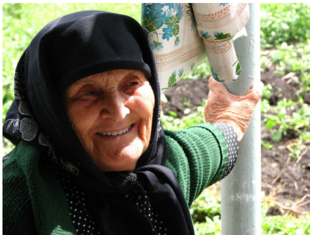
"Бабушка". 9.09.2007г.