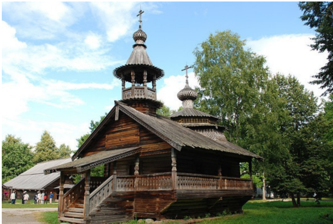
«Витославицы. Часовня из д. Кашира». 18 век.