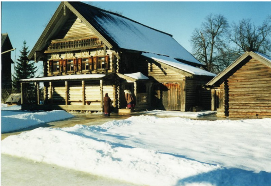
Витославицы. Крестьянская изба, 19 век.

«Праздник скоро, – думал отец, глядя на подтаявший снег. – Пасха Господня ранняя. А на душе ходят тучи черные. Ну что же мне, окаянному, делать? Единственная дочь моя тяжело больна, еле жива.»