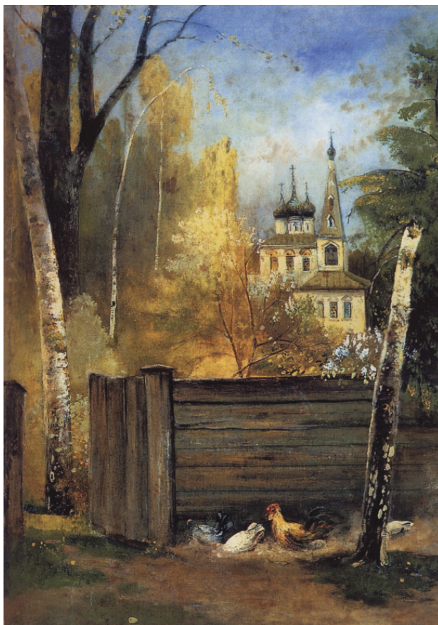
Алексей К. Саврасов «Весна. Провинциальный дворик» 1880—1890-е