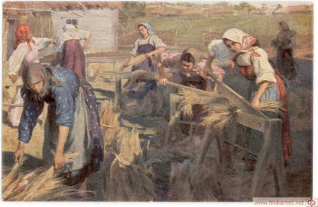
Федот В. Сычков. Трепание льна. Дореволюционная открытка.