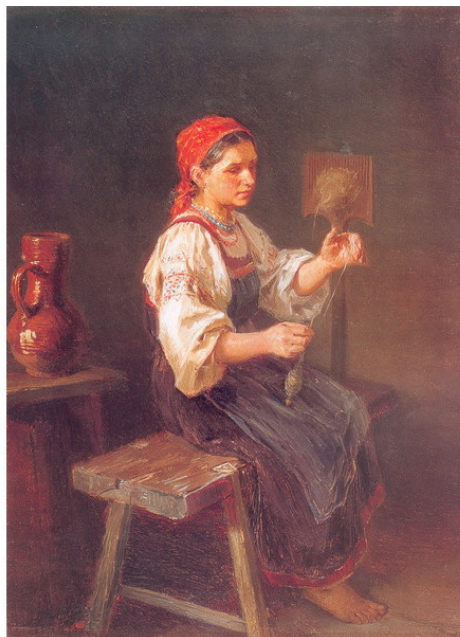
Илларион М. Прянишников «Пряха» 1878 г.

Полевые работы подходили к концу. В конце сентября начали копать картошку и рубить капусту. Другой урожай был уже собран. Просушенную пшеницу и рожь убрали в гумно. То, что мужчины промолотили – засыпали в амбары. Часть своего урожая крестьянин должен был отдать барину в качестве оброка.