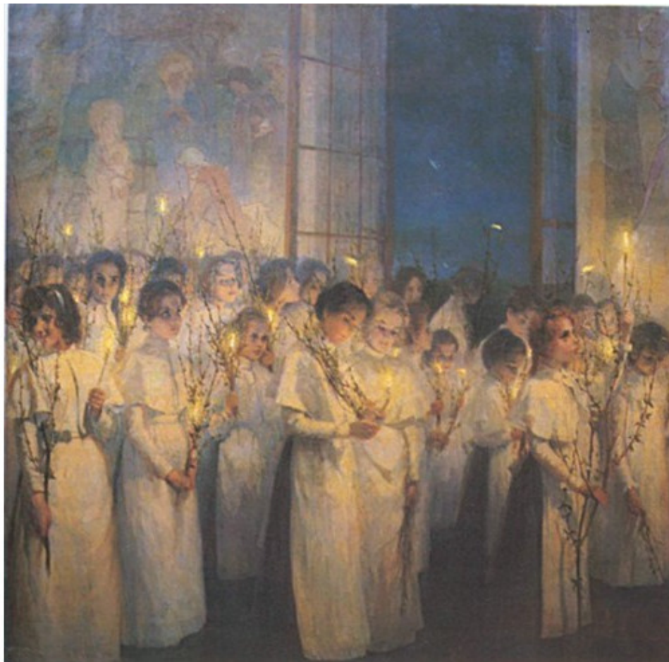
Серафима Блонская «Девочки. Вербное воскресенье» 1900 г.

– Привези мне освященных вербочек, – попросила Евдокия Семеновна Ивана Сергеевича. – Постегаю я ими чуток мою Полечку во здравие телесное.