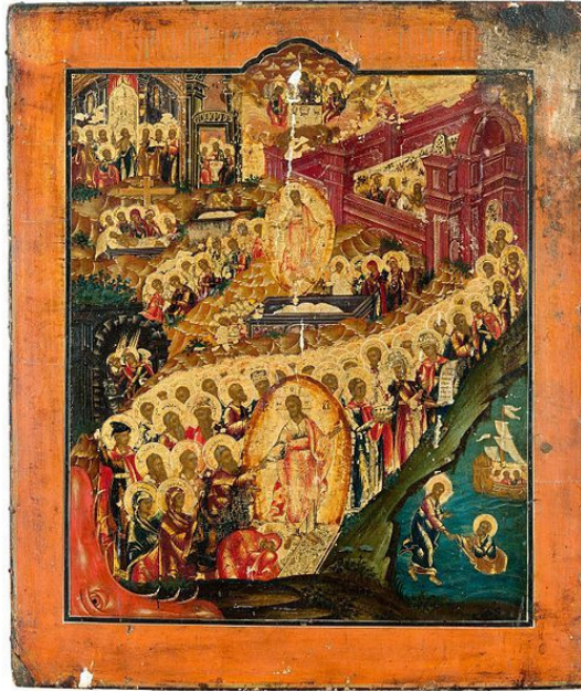
Икона «Воскресение Христа – Сошествие во ад» конец 19 в.