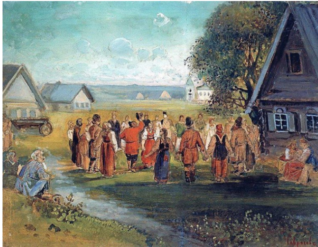
Алексей Кондратьевич Саврасов «Хоровод в селе» 1874г.