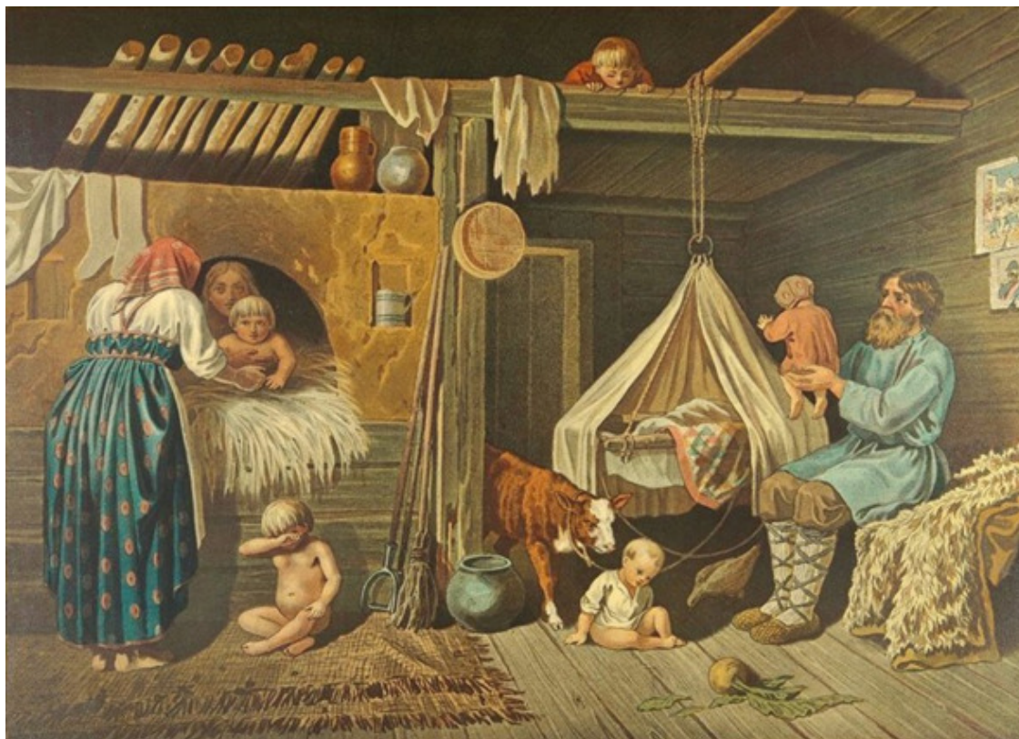
Е. А. Покровский «Крестьянские дети зимой» 1884г.

Ребятишек в каждом доме было предостаточно. Да и как же им не быть, когда в доме не одна и не две, а чаще – три, четыре и пять семей жило, три поколения? Да и как не рожать детей, когда сам Господь человека в мир посылает. Ну и что, что жилось часто бедно, зато потом помощники какие вырастали! И сам Спаситель в Евангелие говорит людям: «смотрите, берегитесь любостяжания, ибо жизнь человека не зависит от изобилия его имения.» Взаимовыручка была обычным и необходимым для жизни делом среди крестьян.