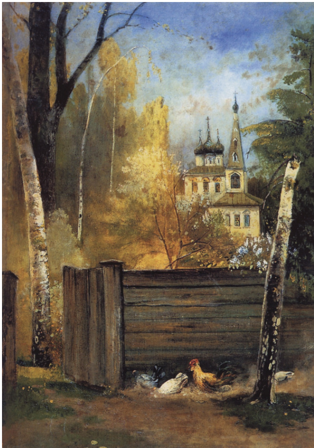
Алексей К. Саврасов «Весна. Провинциальный дворик» 1880—1890-е