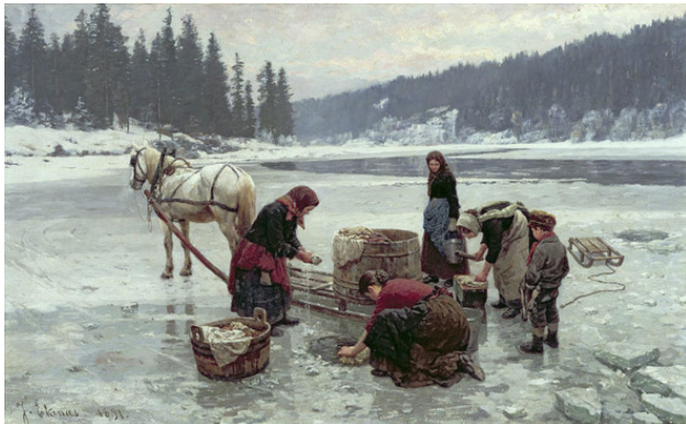
Норвежский художник Ян Экенес «Женщины стирают» 1891 год.