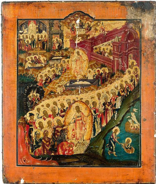
Икона «Воскресение Христа – Сошествие во ад" конец 19