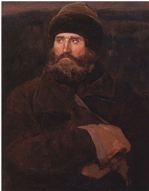
В. М. Васнецов «Крестьянин Владимирской губернии»

избе рядом с густым лесом на краю русской деревни Залесье. Жителей здесь жило не так много и все друг друга знали, ходили друг к другу в гости, а, бывало, и звали на помощь: сено, зерно убрать, избу построить или еще в какой-нибудь работе подсобить. Жили все небогато, ячменного хлеба, бывало, не хватало, особенно по весне. Но трудились честно, своими руками добывали себе и пропитание, и одежду, устраивали свое жилье. От того и унывать им было некогда.