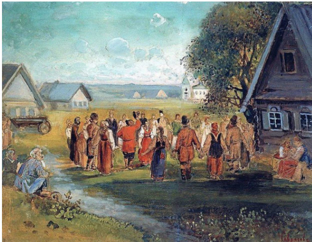
Алексей Кондратьевич Саврасов «Хоровод в селе» 1874г.