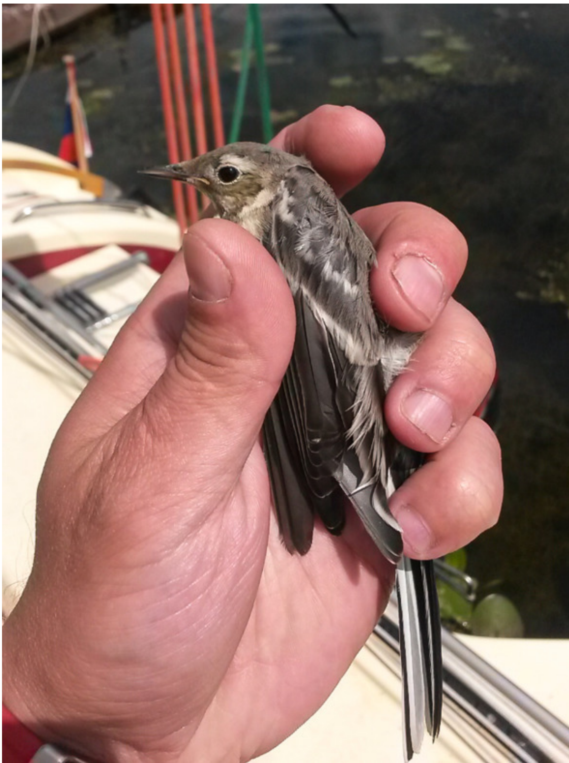
Этот нелегальный пассажир проник в каюту ночью через открытый иллюминатор