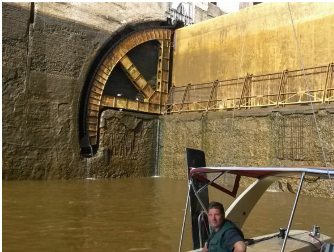
Гигантские размеры шлюзовых механизмов