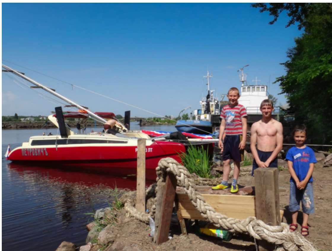
На пляже Шлиссельбурга. Эти три мальчугана помогли установить мачту