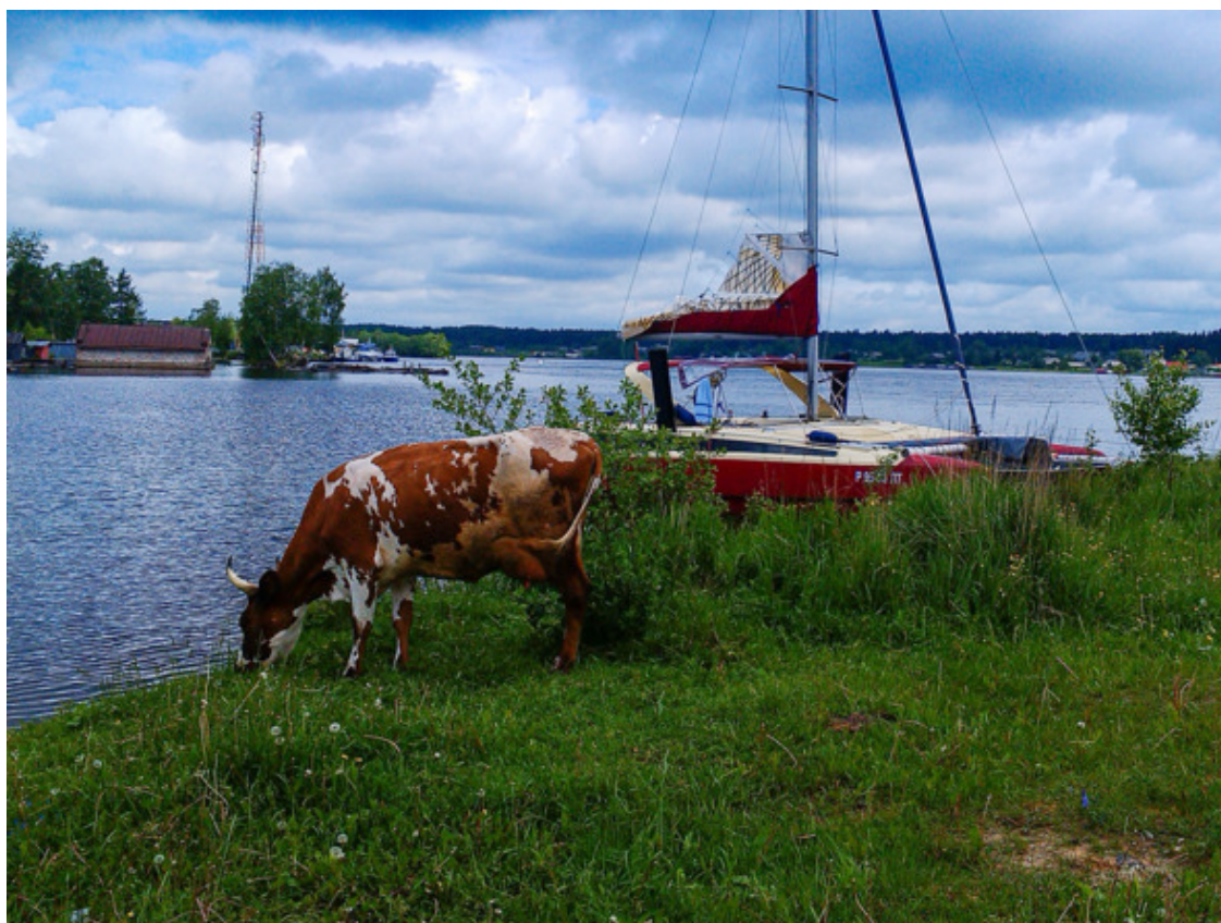
Вознесенье. Гармония цвета и форм