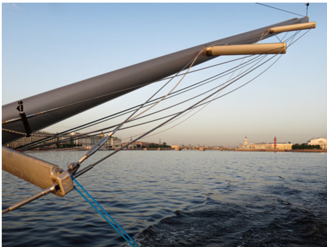
"Срубленная" мачта на фоне Васильевского острова