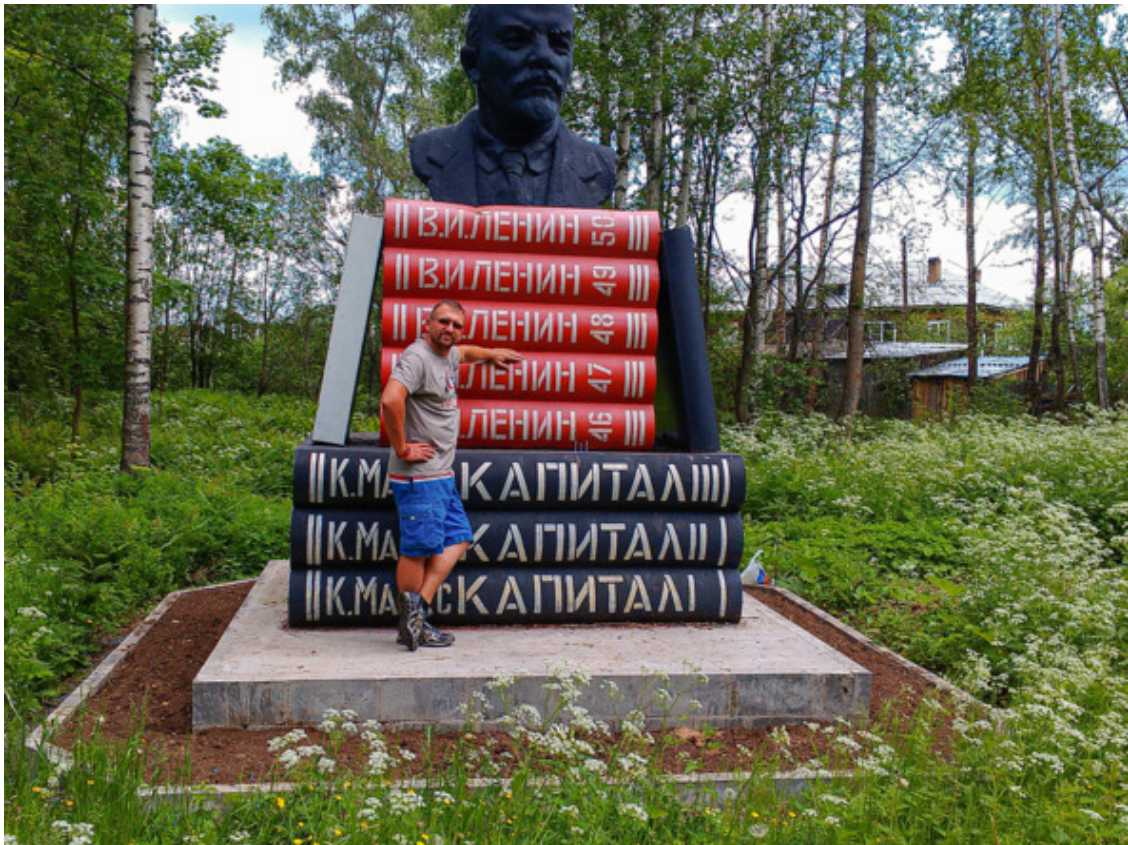
Вознесенье. Вот это формат для настоящего писателя!

Ночевать остановились на входе в Онегу. Городок Вознесенье. Как сказал Витя, на другой стороне реки уже Карелия.