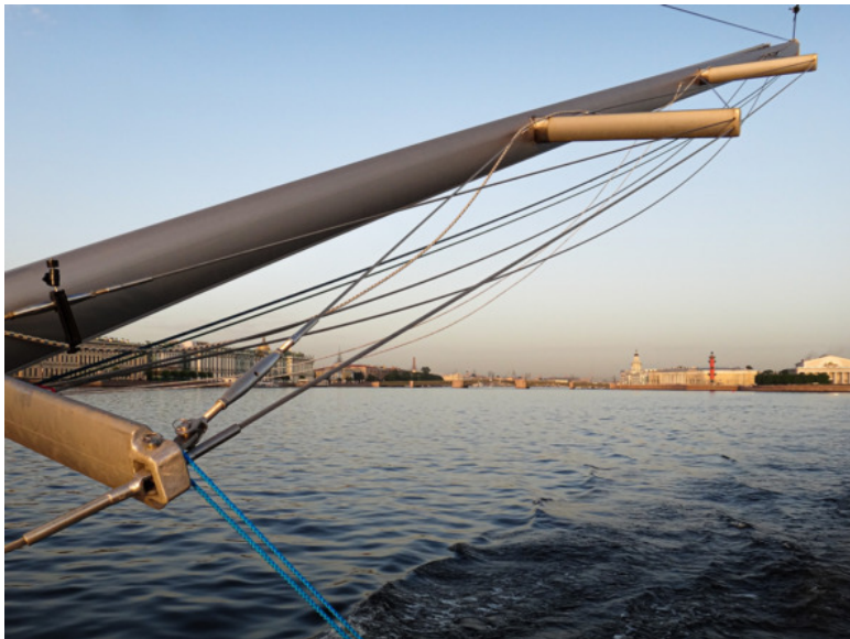
"Срубленная" мачта на фоне Васильевского острова

нутым запасным парусом. Пятница. В соседнем кафе громко играет музыка. По набережной прогуливаются парочки и семьи с детьми. Пришла мысль о том, что как-то неудобно спать в двух метрах от гуляющих по набережной людей, но очень хотелось спать и мне уже вообще было всё равно. Надел на голову бейсболку и закрыл лицо сеткой. Всё! По берегу гуляют люди, обсуждают катамаран, кто-то произносит: «О! Они ещё и спят там!» и переходит на шёпот. Это последнее, что я услышал в этот длинный день.