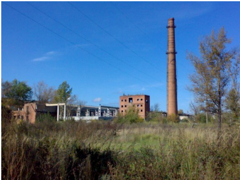
фото 2007 года