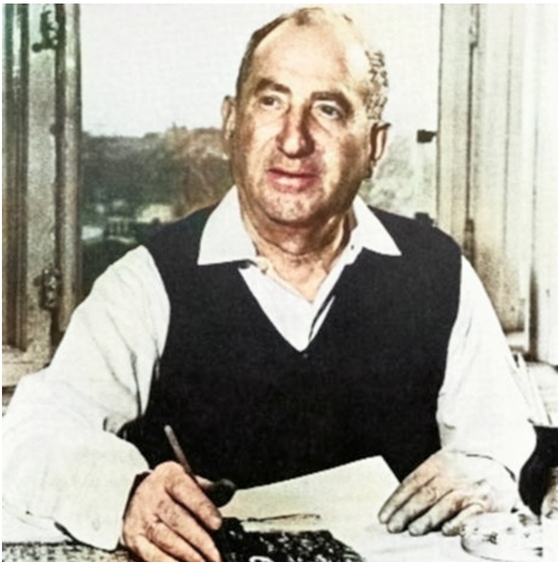
Анатолий Львович Каплан. http://www.lechaim.ru/ARHIV/198/frezinskiy.htm File: Анатолий (Танхум) Каплан.jpg. Источник: https://ru.wikipedia.org/wiki/Каплан,_Анатолій_Львович#/media/Файл:Анатолій_(Танхум)_Каплан.jpg

жизни «штетла», еврейское наследие и духовность, а его детские впечатления оставались одним из его главных источников вдохновения на протяжении всей его жизни. Имя художника завоевало признание в конце 1960-х годов. К тому времени он уже завоевал мировое признание, и его работы пользовались большим успехом в Германии, США, Англии, Канаде, Австрии и Италии. (Anatoly Kaplan – Pinterest) [7]