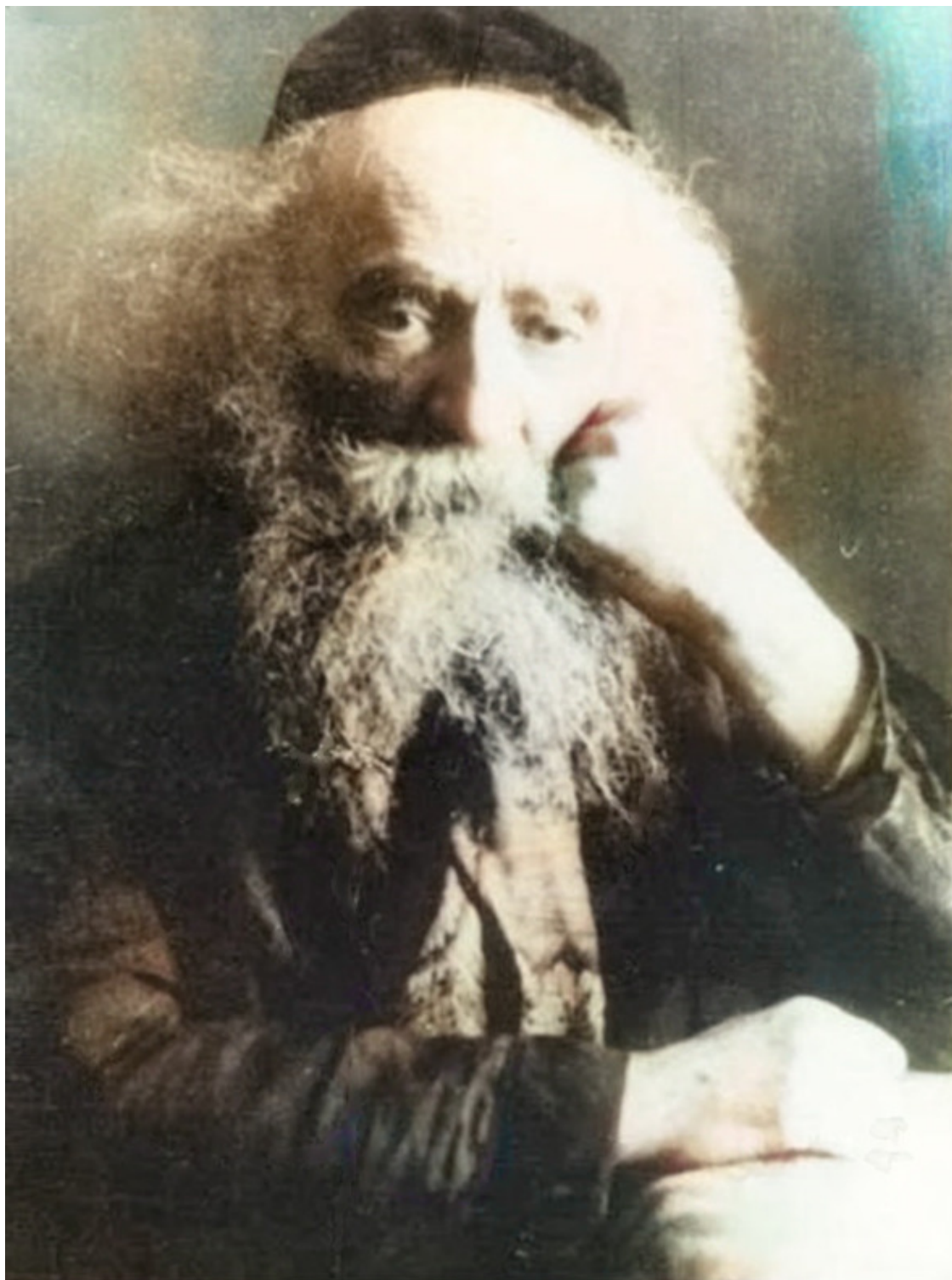
Рогачевер.

Рогачевер был известным талмудистом своего времени И он опубликовал ряд своих работ, касающихся Талмуда и трудов Маймонида. Его основная работа, комментарий к Маймониду, была опубликована при его жизни, а также были изданы пять подготовленных им томов респонсов к галахическому (еврейскому) закону.