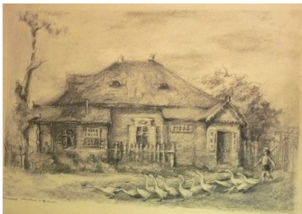
Рогачев. Мальчик с гусями. 1954год 40x55.