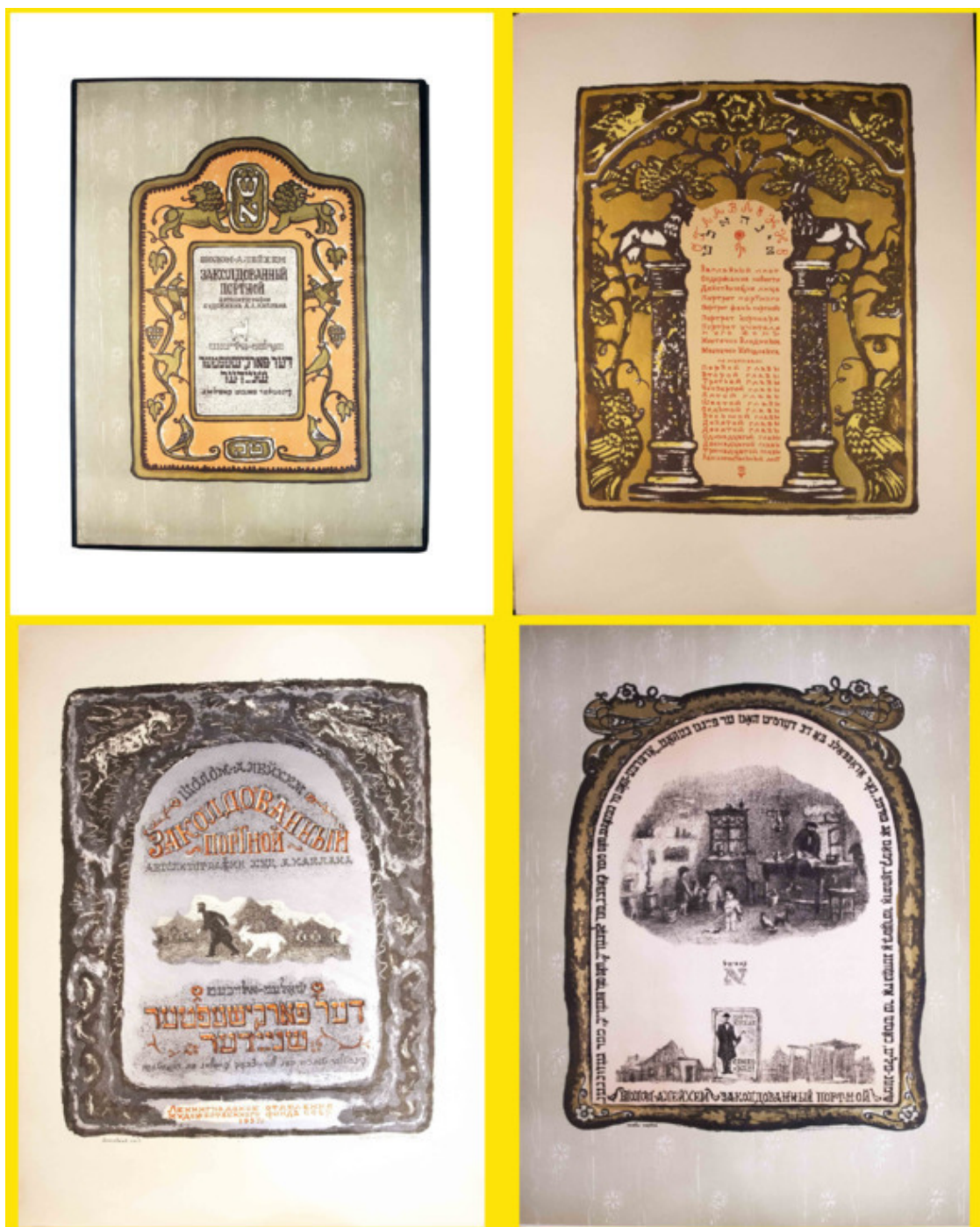
«Каплан, А. Л. Шолом-Алейхем. Заколдованный портной / Автолитографии художника А. Л. Каплана; Ред. Е. Б. Гуткина; Печатники: Б. И. Володин, А. С. Иванов, Ю. Д. Матюхин. – Л.: Ленингр. отд. худ. фонда СССР, 1957. – [1] л., [26] л. ил.; 61,5 x 45 см. – 600 экз. 26 иллюстраций художника А. Л. Каплана выполнены в технике автолитогравии ручным способом с оригинальных камней лимитированным тиражом». Источник: http://anticvarium.ru/lot/show/11035

Период 1950-го—1951-го г. г. В данном временном периоде Каплан работал в качестве главного художника Ленинградского стекольного завода.