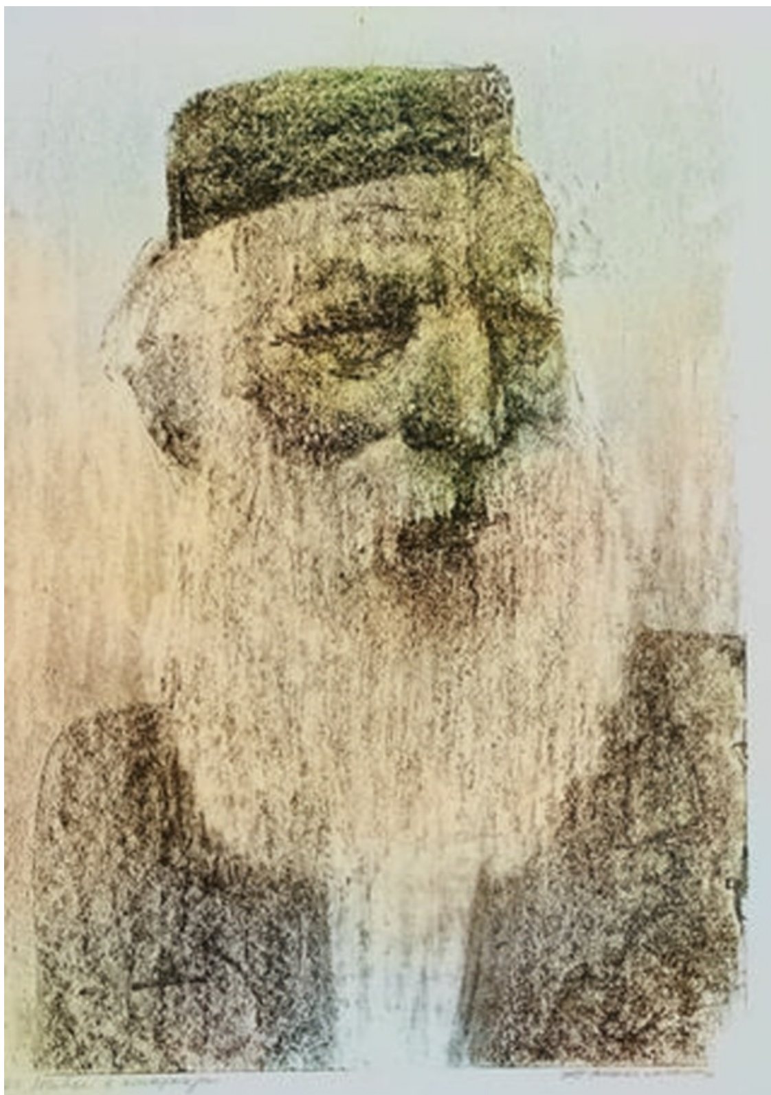
ТЕБЕ В СТАРОСТИ. Л. КАПЛАН.