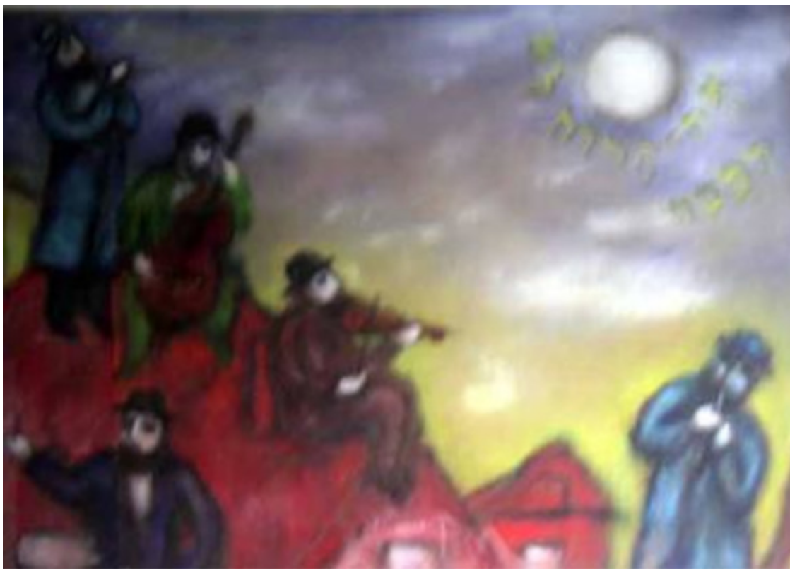
Музыканты (1968) Каплана. Источник: https://en.wikipedia.org/wiki/Anatoli_Lvovich_Kaplan

«Документально этот факт нигде не зафиксирован, но у Исаака Кушнира есть свой авторитетный источник: