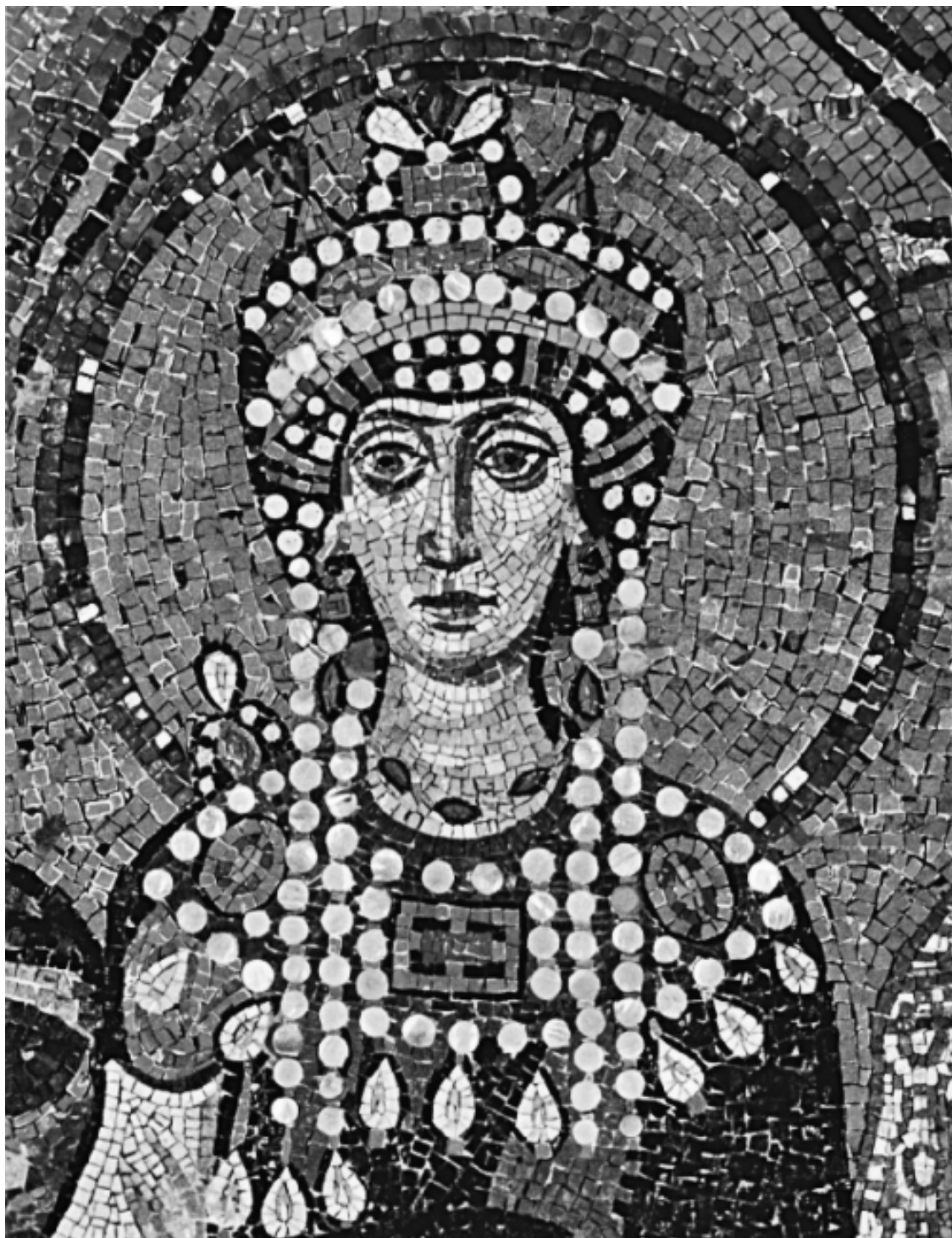
Фрагмент мозаики с изображением императрицы Византии Феодоры. Церковь Сан-Витале в Равенне

Но в период Ренессанса все больше упрочивается и вторая роль жемчуга как эротического символа, зачастую связанного с продажной любовью. Если на картинах художников Ренессанса изображена женщина в жемчугах и прозрачных одеждах, эта особа наверняка является либо любовницей высокопоставленной особы, либо куртизанкой.