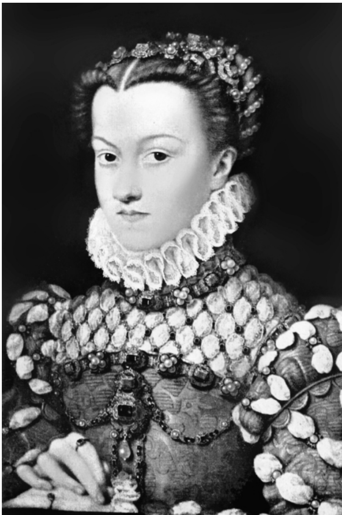
Елизавета Австрийская, супруга короля Франции Карла IX