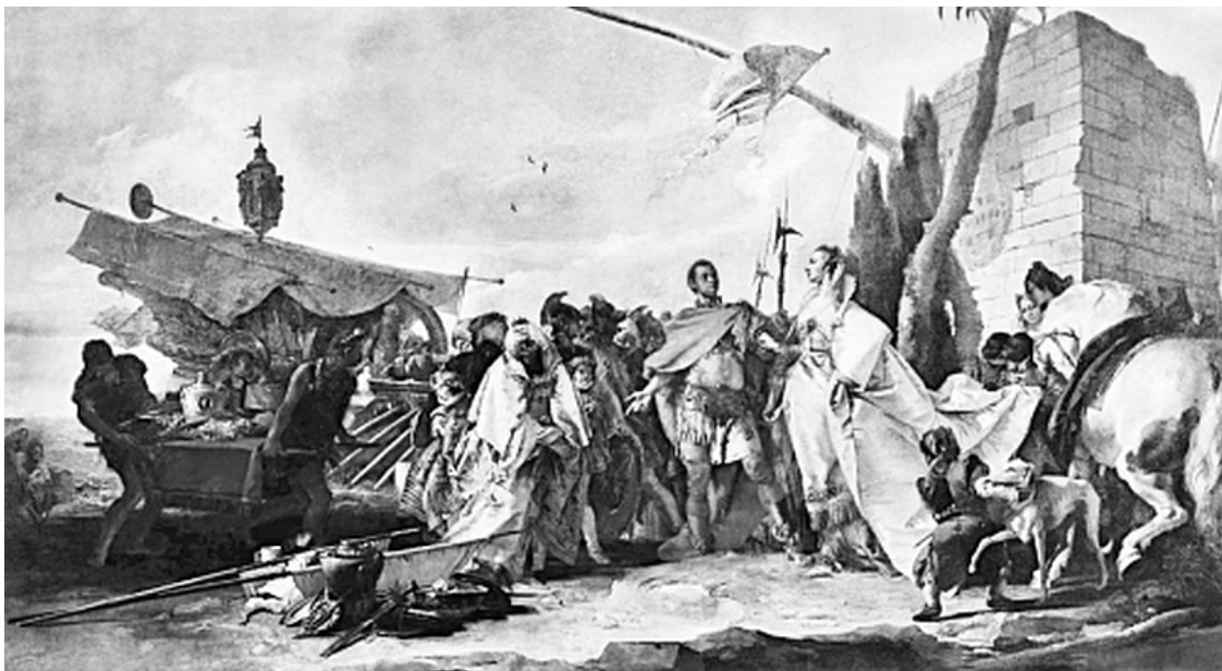
Дж.-Б. Тьеполо. «Встреча Антония и Клеопатры»

полотна кисти венецианского художника Тьеполо: «Встреча Антония и Клеопатры» и «Пир Клеопатры». На первом изображено возвращение Антония из похода в Армению. Полководца сопровождает пышная свита, из-за плеча победителя выглядывает плененный армянский царь. Антоний горделиво указывает Клеопатре рукой на брошенные к ее ногам трофеи, среди которых видна, между прочим, и кучка жемчужных украшений. Ну, а на другом представлен торжественный момент пира, когда Клеопатра собирается бросить драгоценную жемчужину в коварное вино.