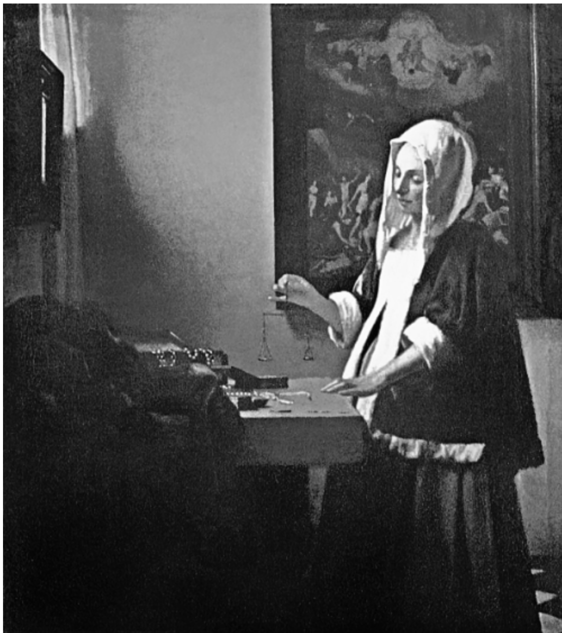
Ян Вермер Дельфтский. «Фасовщица жемчуга»

Через какую же армию рук прошли многие из жемчужин, добытых до начала XX века, когда люди научились культивировать жемчуг! В небытие ушли сотни тысяч, может быть, миллионы безымянных и безликих ныряльщиков, торговцев, моряков, ювелиров, низальщиков зерен, швей. Результаты их трудов почти не сохранились – ведь старинные драгоценности стали объектом коллекционирования лишь с конца XIX века. В основном мы можем видеть их только на портретах особ, носивших эти украшения. Вот они шествуют по страницам истории: мужественные воины и угодливые придворные, аристократические красавицы и простые крестьянки, добродетельные девицы и бесстыжие блудницы, королевы и манекенщицы, оплывшие от жира купчихи и очаровательные детишки. Украшения из жемчуга, в отличие от драгоценных камней, не особенно разнообразны, но сколь зачастую удивительны судьбы людей, носивших их! Каким неожиданным образом переплетаются они вокруг ожерелья или серег, передаваемых из поколения в поколение! Приносил ли жемчуг счастье или несчастье своим