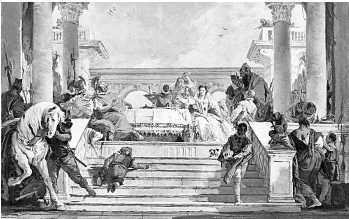
Дж.-Б. Тьеполо. «Пир Клеопатры»