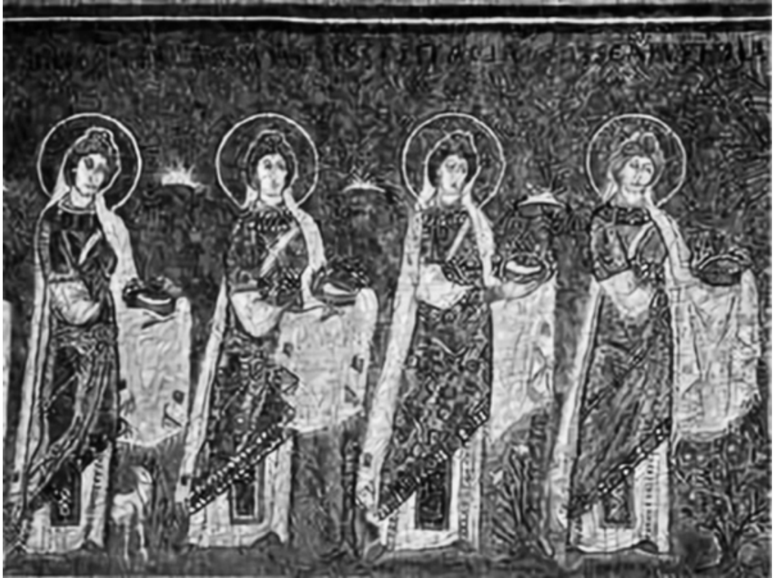
Фрагмент мозаики «Шествие 22 девственниц». Церковь Сант-Аполлинаре Нуово в Равенне

стителю. И одежды, и венцы августейших супругов обильно украшены крупными жемчужинами, у Феодоры еще добавлены пропендулии – длинные подвески из жемчуга, ниспадающие с венца.) Надо сказать, что дань этой традиции не преминул отдать и ислам. Например, в Коране так говорится о благочестивых, пребывающих в садах блаженства: «Будут обходить их [с яствами] отроки, отданные им [в услужение], подобные жемчугу [в раковине] нетронутому».