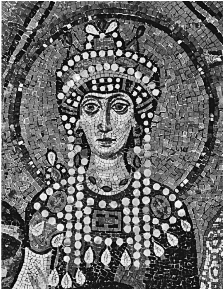
Фрагмент мозаики с изображением императрицы Визан-