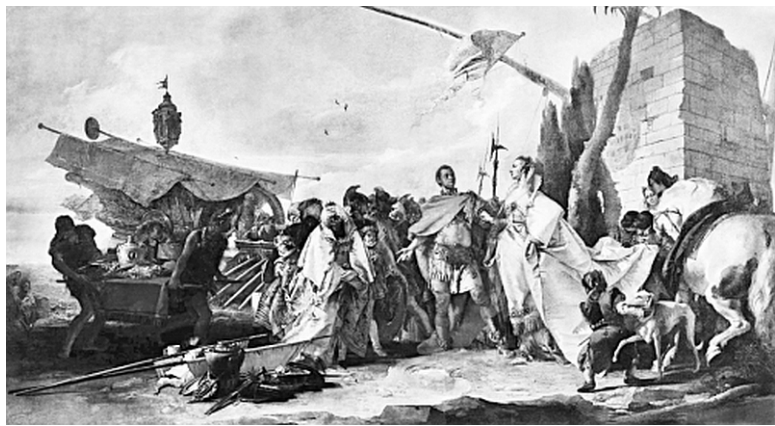
Дж.-Б. Тьеполо. «Встреча Антония и Клеопатры»