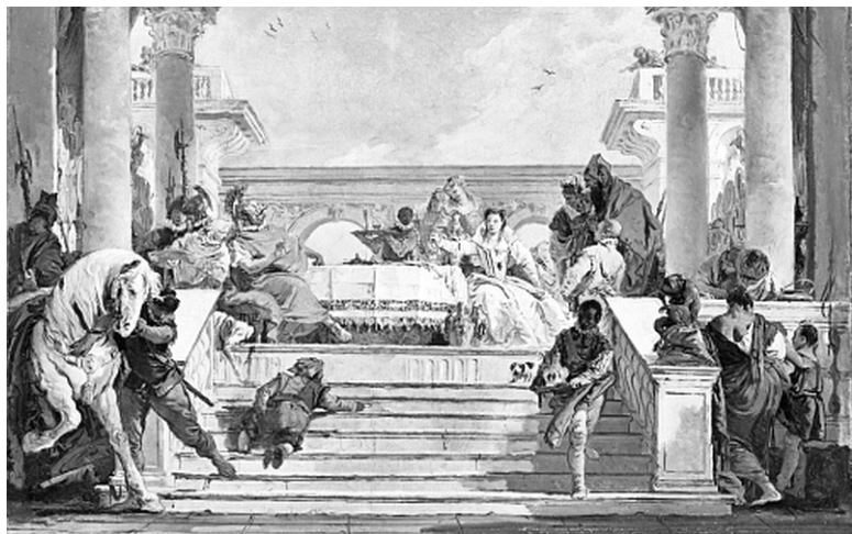
Дж.-Б. Тьеполо. «Пир Клеопатры»