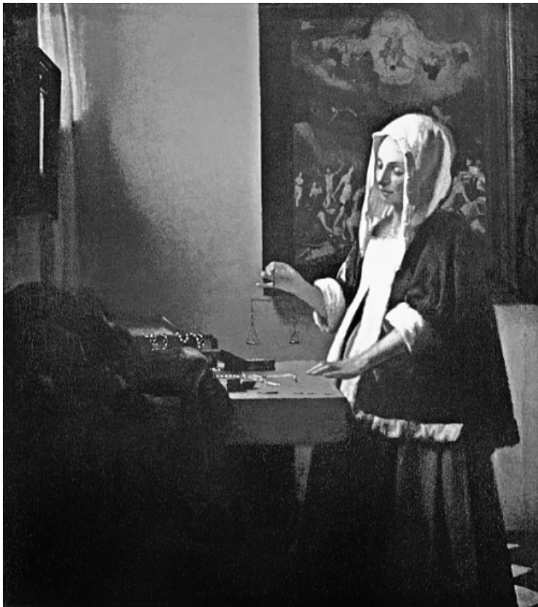
Ян Вермер Дельфтский. «Фасовщица жемчуга»

Через какую же армию рук прошли многие из жемчужин, добытых до начала XX века, когда люди научились куль-