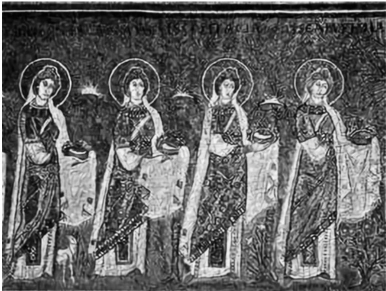
Фрагмент мозаики «Шествие 22 девственниц». Церковь Сант-Аполлинаре Нуово в Равенне