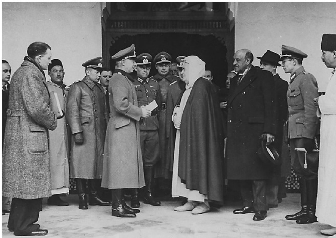
ФОТО 3.3. Си Каддур Бенгабрит, имам Парижской соборной мечети, приветствует представителей вермахта

евреев, но до сих пор не было найдено никаких архивных свидетельств, подтверждающих этот факт.