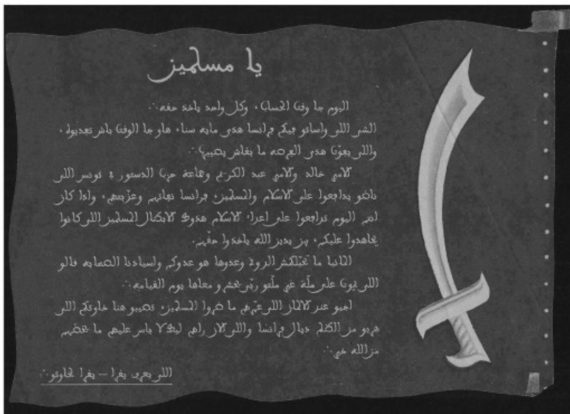
ФОТО 3.1. Немецкая пропагандистская брошюра, 1940