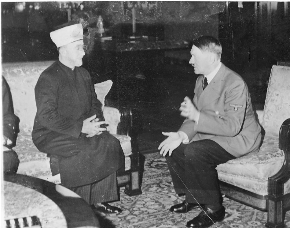
ФОТО 2.1. Амин аль-Хусейни и Гитлер в новой рейхсканцелярии.

Берлин, 28 ноября 1941 года