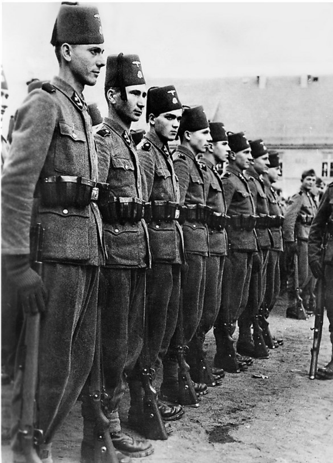
ФОТО 1.1. Полицейские-мусульмане в фесках.

Немецкая колония Камерун, 1891