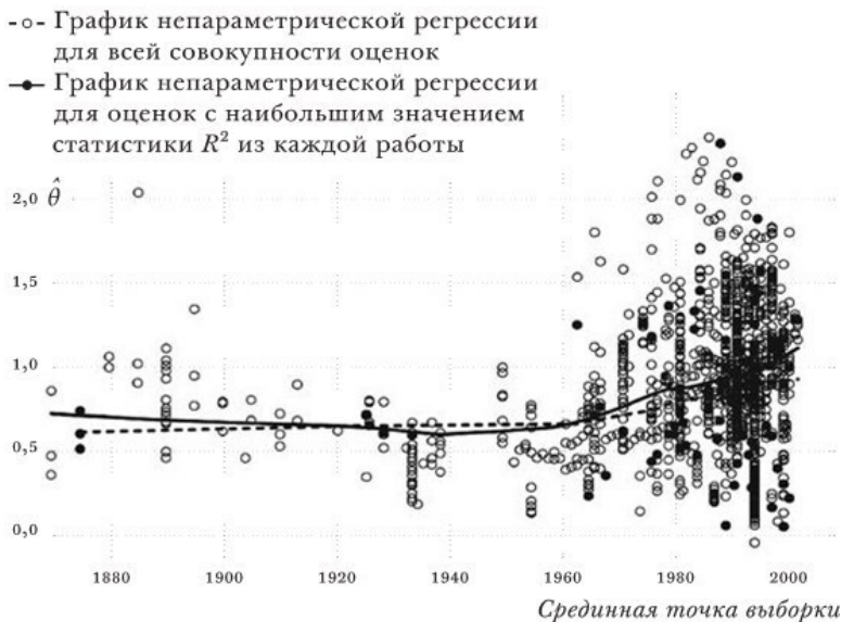
РИС. 2.4. Оценка эффекта расстояния ( \hat{\theta} ) в различные моменты времени

зую внутренне согласованный набор данных по международной торговле. Бертелон и Фройнд показали, что данный результат обусловлен не изменением структуры товарных потоков (переходом от товаров с низкой эластичностью к высокоэластичным товарам), а «значительным и растущим воздействием расстояния на торговлю почти в 40% отраслей» 48 .