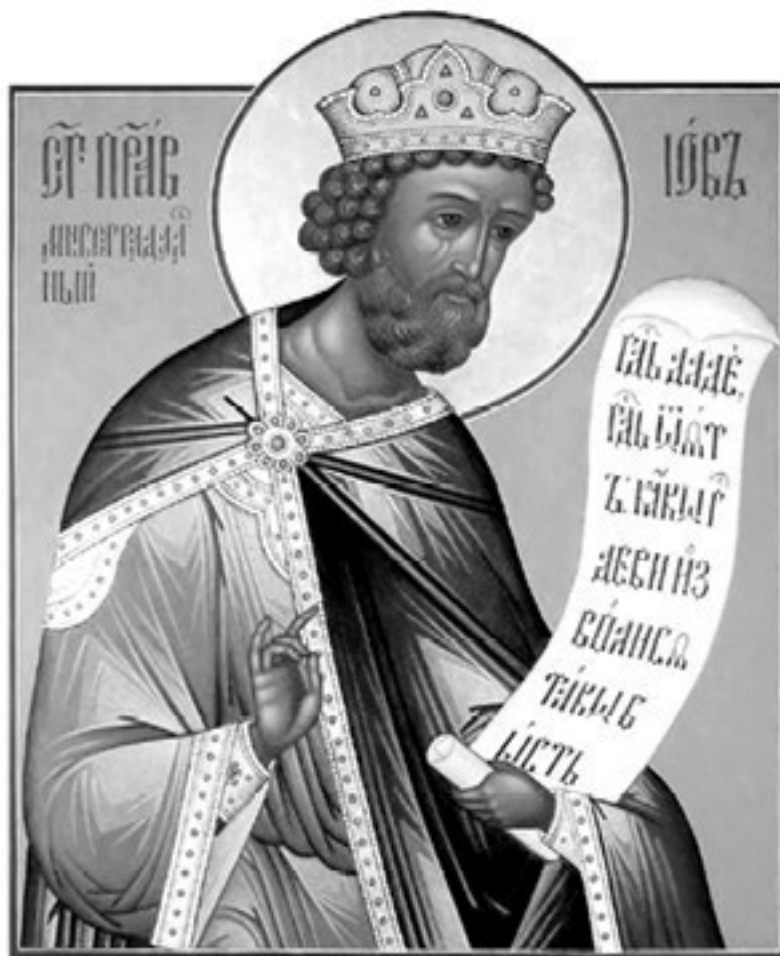
Святой праведный Иов. Современная икона

Человек, знающий Бога, удаляющийся от зла, посрамляющий диавола, претерпевающий все, прославляющий Бога и входящий в вечность, – это человек по замыслу Божию. Вот такой должен быть человек. А мы просто еще не знаем, кто мы такие. Как святитель Иоанн Богослов осторожно говорит: «Дети, мы еще не знаем, кем будем. Мы знаем только, что мы увидим Его, какой Он есть». Мы еще не знаем, кто мы есть и кем мы будем. Действительно, мы – загадка для себя самих. И расцвет психологии, например, или антропологической философии связан с тем, что человек неисчерпаем. Гораздо интереснее общаться с человеком, чем со звездами. С человеком, а не с глубинами морскими. С человеком, а не с ветрами, штормами. Потому что в мире все замкнуто на человека. Что ты подумаешь – то и будет. Как ты скажешь – так и произойдет. Как ты согрешишь – будет вот так вот. Помолитесь – будет вот так вот. Мы же на святых это видим. Видим, как отступает стихия, как преклоняются животные перед человеком. То есть святые – это некое снятие штормки перед тем, каким должен быть человек. Человек не должен быть таким, каким мы его видим. Наш собеседник, спутник, современник в транспорте, на улице, в телевизоре – он не такой, каким должен быть. Человек должен быть другим. И Церковь говорит нам: это не человек еще, это – некая возможность человека. Ведь и рождается человек не как «готовый продукт», а как возможность.