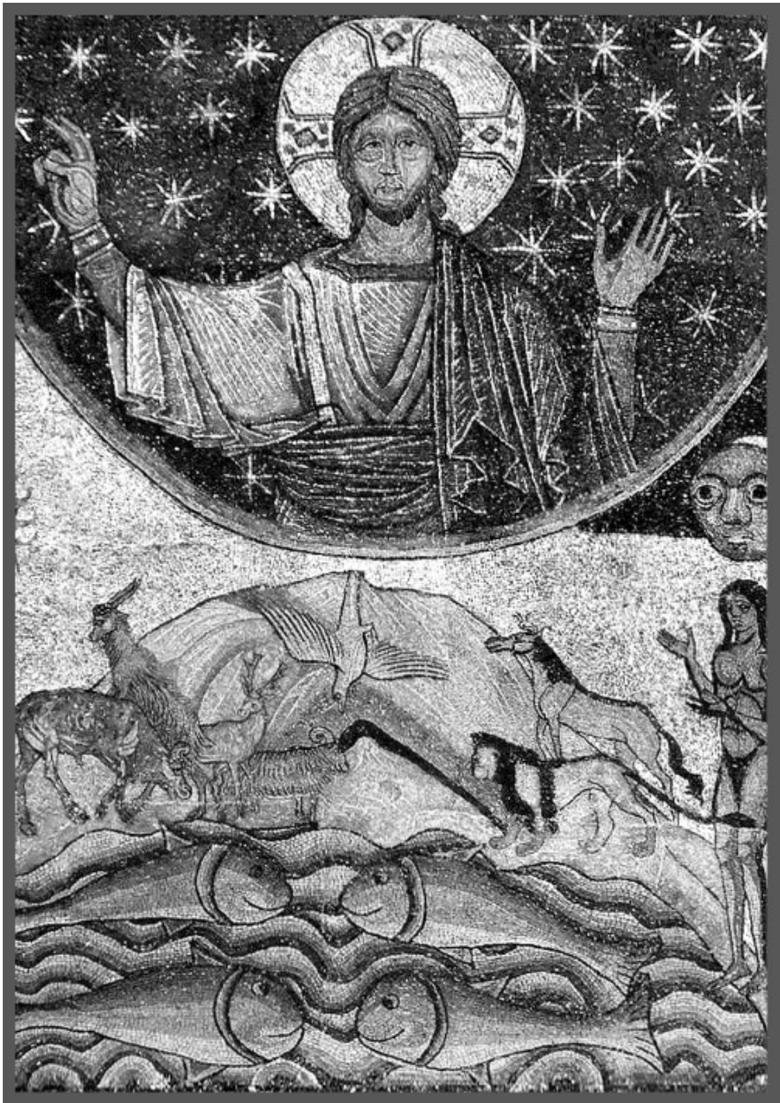
Сотворение мира. Мозаика. XII в.

Потому что если дитя родится, то не твоими силами, а Божией силой; если трава растет, то не твоей мудростью, а Божиим благословением. А если Ты, Господи, вдруг не разрешишь, то и дитя не родится, и трава не вырастет, и хлеб не заколосится, и дождя не будет, и то будет, и это будет. Потому что Бог командует миром.