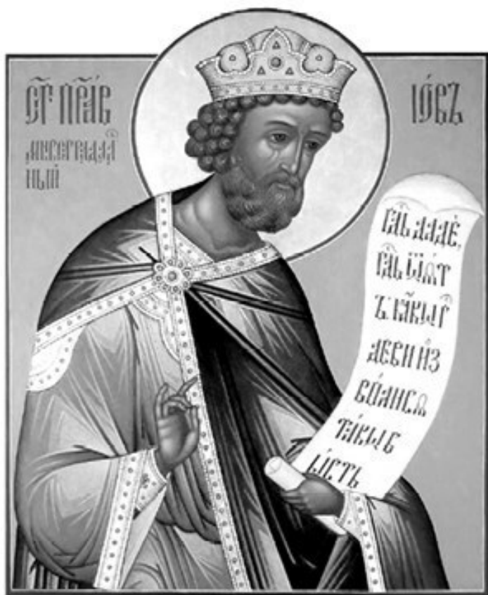
Святой праведный Иов. Современная икона