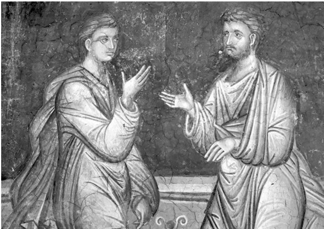
Филипп зовет Нафанаила ко Христу

Бог может показать тебе много хороших вещей, а не только, как ты говоришь, скорбь и боль, также и хорошие вещи, которые есть у Бога для тебя; но твой ум думает только о плохом, и ты напрасно беспокоишься. Христос покинул этот мир, и огромное множество людей становятся миссионерами – тысячи людей становятся последователями Христа, жертвуют собой для Него. Одни отправляются в миссионерские поездки в Африку (в Заир, Конго), на Аляску, в Индию, другие становятся монахами – ради Кого? Ради Него, ради православия, ради Того, Кто сказал: «Посмотрите, что произойдет, когда Я покину этот мир».