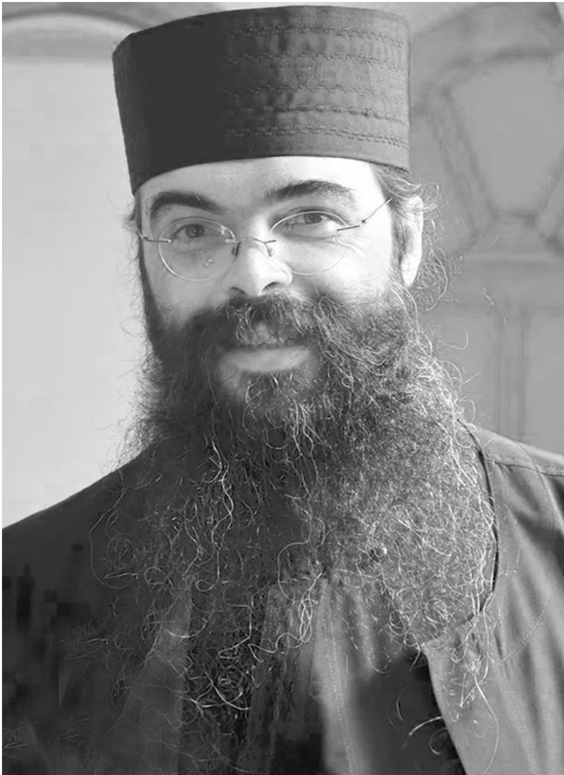
Архимандрит Андрей (Конанос)

Согласен, я видел это за границей и в некоторых местах в Греции, и вообще на свете много хороших семей, спокойных, тихих, благородных, с хорошими манерами. Но я же и не говорил, что все остальные – какие-то людоеды, что они тебя съедят, но когда они такие? Когда у них есть деньги и они благоденствуют, когда они здоровы и смеются. Все у них идет хорошо, и они выдерживают это. Однако я не видел, чтобы нагрянуло то землетрясение, о котором я говорил, и они бы выдержали. Когда начнется землетрясение, эти благородные, приличные