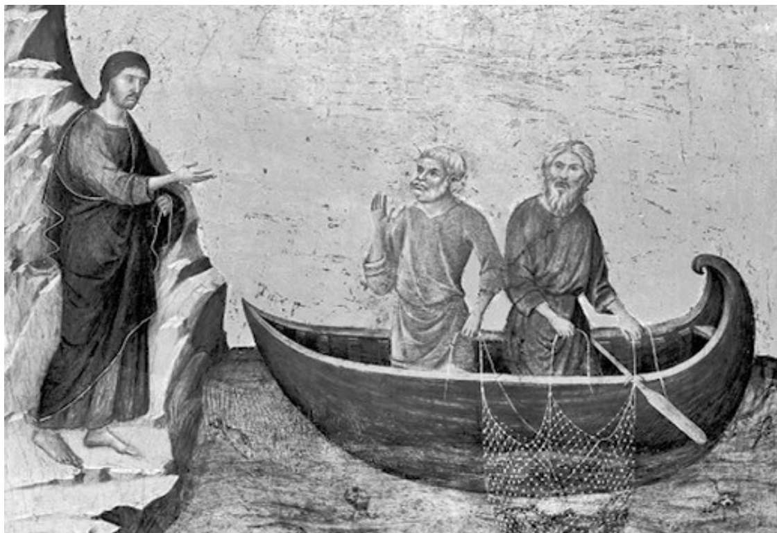
Христос избирает Петра

– Помоги мне что-нибудь сделать для тебя, человек! Мне нравятся люди, которые позволяют Мне войти в их души и помочь им, обрабатывать, освящать, стирать их грехи, вытирать слезящиеся глаза, очищать загрязненные сердца.