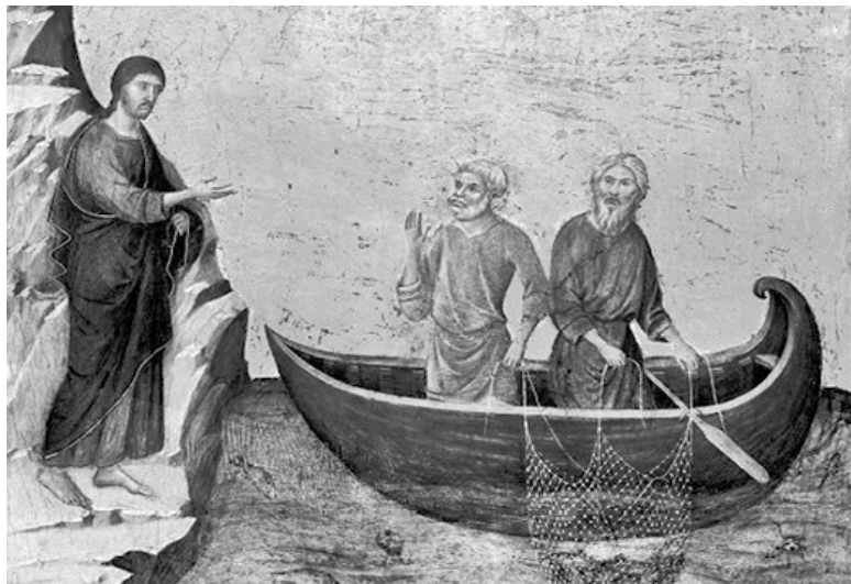
Христос избирает Петра

– Помоги мне что-нибудь сделать для тебя, человек! Мне нравятся люди, которые позволяют Мне войти в их души и помочь им, обрабатывать, освящать, стирать их грехи, вытирать слезящиеся глаза, очищать загрязненные сердца.