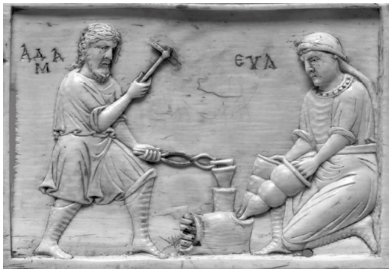
Адам и Ева

хочет от мужа тепла и нежности. Бог создает Еву из ребра Адама, потому что ребро расположено близко к плечам, которые означают силу, надежность, опору». Жена хочет чувствовать в своем супруге эту надежность и опору, чувствовать, что он ее укрепляет, что есть кто-то, с кем она может поделиться, кому выскажет свои проблемы, мучения и получит поддержку и силу.