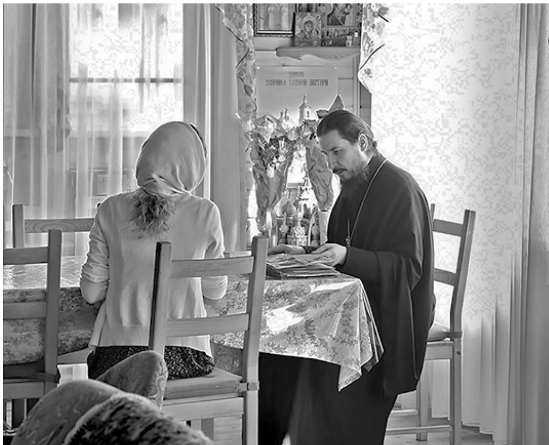
С епископом Силуаном Бортсурманы. Май 2017 г.