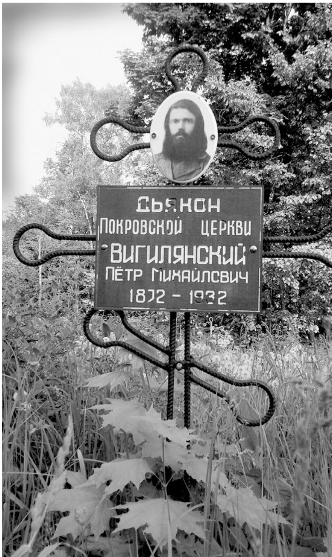
Вязники. Могила дьякона Петра