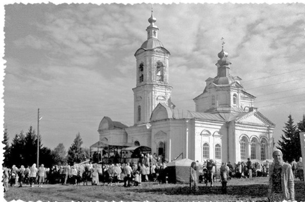
Бортсурманы 17 августа 2016 г.

Кончился август, началась обычная московская рабочая жизнь, но я чувствовала, что она уже никогда не будет такой, как прежде. Недавние чудеса, упавшие с неба, перевернули мой мир, преобразили его нездешним светом, и к этому свету невозможно было привыкнуть. Я чувствовала бесконечную благодарность Богу и собственную малость, своё недостойнство и незаслуженность чуда, которое со мной стряслось – именно стряслось, как вулкан, как землетрясение, как разверзшиеся небеса.