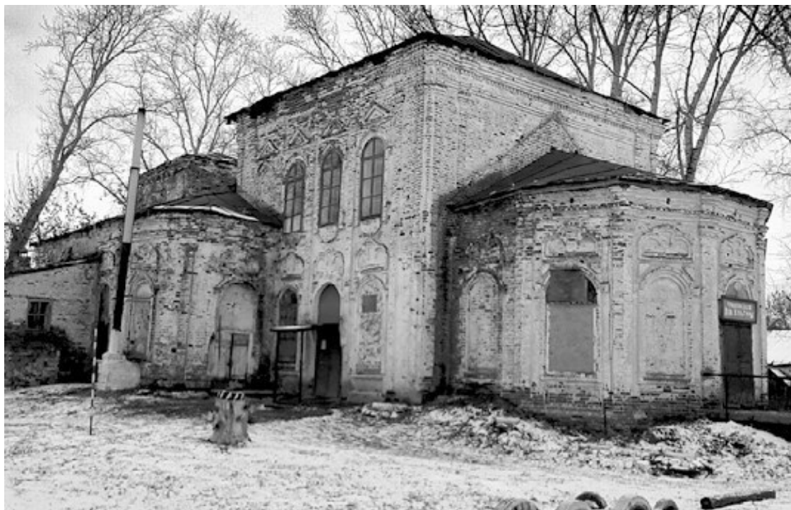
Курмыш. Храм прапрадеда

О селе Бортсурманы нельзя рассказывать мимоходом: это место, в котором скрестилось для меня всё, что связано с представлением о Руси, о глубинке, о прошлом, о Родине, об истоках – о чём-то бесконечно родном, корневом, кровном, нутряном, отеческом, нашем. Надо было проехать каких-то 25 километров, чтобы окончательно отменилось время. Я попала в картинку из хрестоматии, из книжки с названием «Русь изначальная», в Землю обетованную, откуда мы все приходим. Представьте себе: зелёные просторы, деревенские домики, околицы, козы, петухи, и дорога, и холм вдалеке, и белоснежный храм на холме – невозможно прекрасный. Я словно возвращалась домой после долгой разлуки – это чувство узнавания, его нельзя ни с чем перепутать. Я была абсолютно очарована и взволнована, но даже не могла предположить, какое новое потрясение ждёт меня здесь.