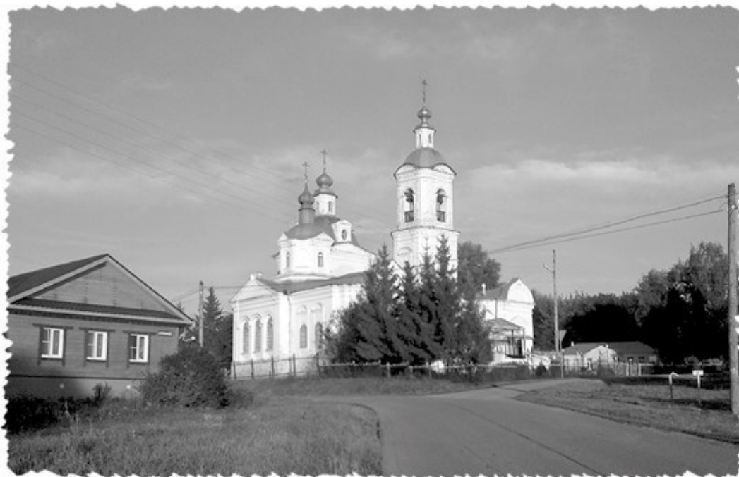
Бортсурманы 17 августа 2016 г.