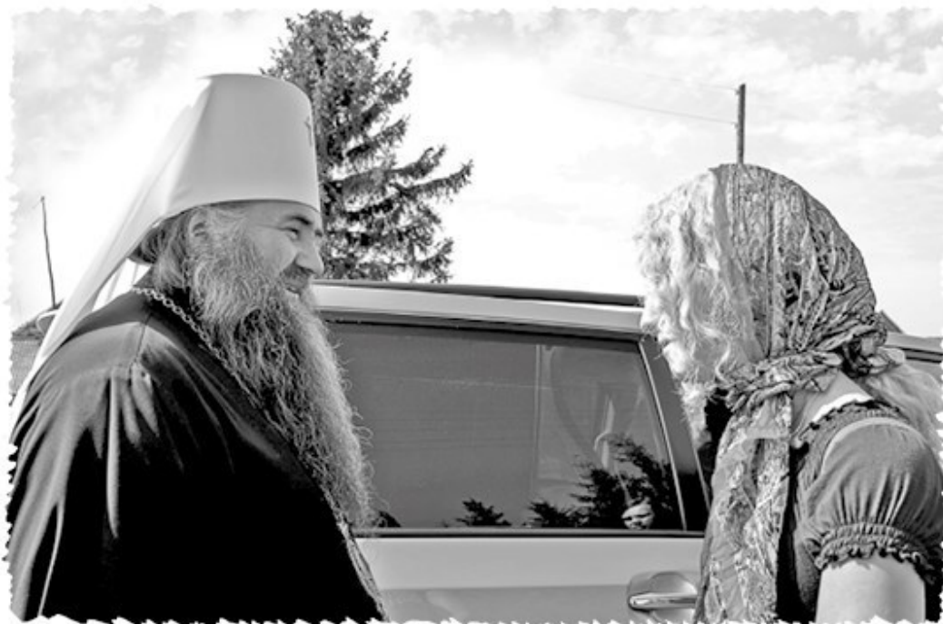
Бортсурманы. С митрополитом Георгием 17 августа 2016 г.

сказал, что же мне теперь делать. Я обрела нового молитвенника – своего чудесного дедушку с пятью «пра», который, как выяснилось, всегда находился рядом, но теперь я знала его в лицо и стала постоянно к нему мысленно обращаться. В октябре, по внезапному наитию, я написала его портрет – чтобы с ним побыть, чтобы оказаться к нему поближе. Я населила свою картину чудесами из его жития – изобразила святых, которые ему являлись, нарисовала Успенский храм, по которому я уже скучала, и самого праведного Алексия на первом плане: я с трепетом водила кисточкой, а он постепенно оживал, и мне казалось, что он мне отвечает. На рамке я написала самые пронзительные слова из его акафиста – мне хотелось принести ему хвалу, хоть что-то для него сделать: «Радуйся, ведевый дальняя яко ближняя, радуйся, предзревый будущая яко настоящая...» – ведь этот его провидческий дар коснулся меня самой. Я совсем никакой не художник, и моё внезапное вдохновение не имело отношения к искусству в том понимании, какое обычно вкладывают люди творчества в свои художественные задачи, – это было порывом любви, поводом пообщаться с дивным дедушкой, который стал для меня родным.