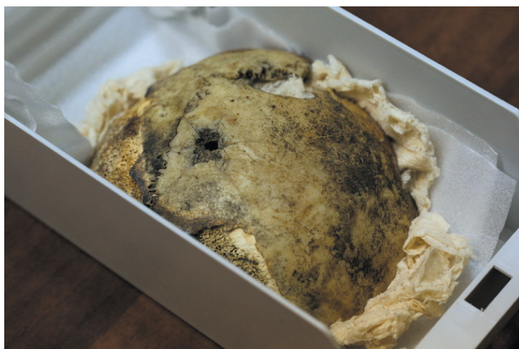
Фрагмент черепа, хранящийся в архиве ГА РФ. Предположительно череп Гитлера.