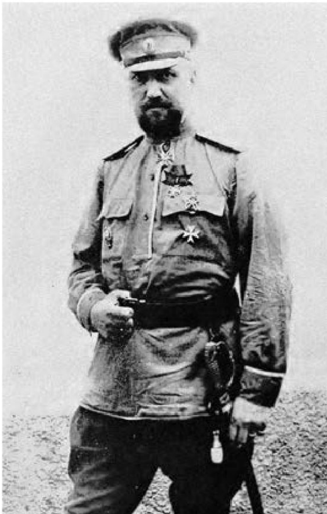
© А. Веселов, оформление, 2019 © Фонд «Люди и книги», 2019 © Фонд «Люди и книги», макет, 2019