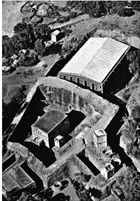
Церковный ансамбль Лалибэлы. Аэрофотоснимок 1965 года

Действительно, Лалибэла прославилась постройкой знаменитых монолитных церквей Эфиопии. Вырубленные в скалах, эти церкви в те времена были вершиной архитектуры. Этот церковный ансамбль находится в городе, носящем имя Лалибэлы (бывший город Роха).