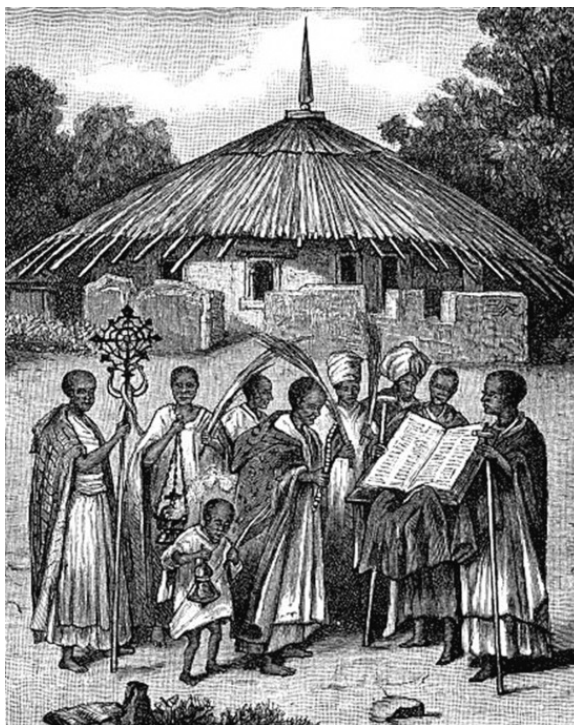
Духовенство Эфиопии. Гравюра 1886 года

Основателем Дэбрэ-Бизэна был абба Филипос (1319–1403), ученик Евстахия. Именно абба Филипос сделал монастыри устава Евстахия сильнейшими на севере Эфиопии. Монахи этого устава считали, что своим значением они также обязаны крупным земельным пожалованиям императора Давида I.