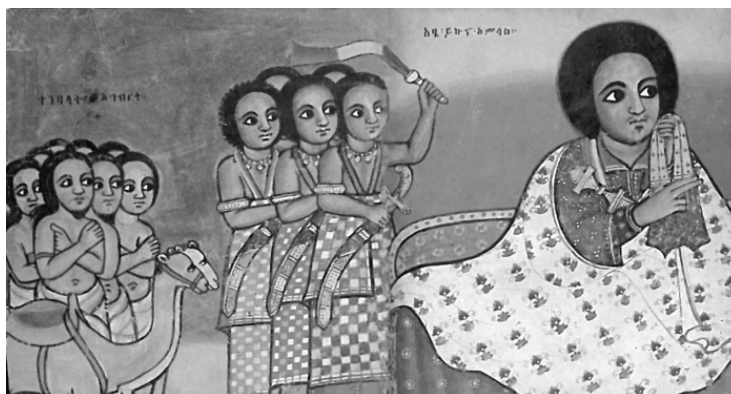
Мусульманские пленные перед императором Йикуно-Амлаком. XVIII век

В отличие от эфиопского христианского государства, отличавшегося организационным единством, основанном на политическом институте императорской власти, которой формально или фактически подчинялись правители областей и феодалы, в исламских султанатах не было центральной власти. Отдельные султанаты боролись друг с другом, и если один из них одерживал победу над другими, то его господство выражалось не в стремлении распространить на остальных свою власть, утвердив её как единственную, а в сохранении доминирующего положения. Поэтому между отдельными султанатами и эмиратами постоянно велась междоусобная борьба.