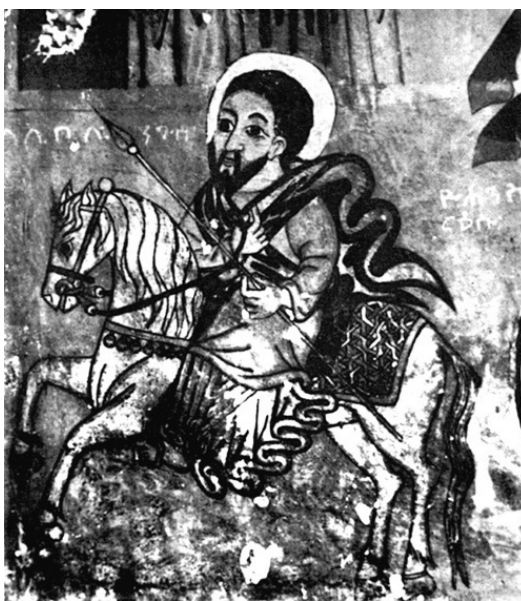
Царь Лалибэла. Фреска XIII века

Каким именно образом Загуйе пришли к власти, неизвестно. На этот счёт есть только легенды. Одна из них выше приводилась. Согласно другой, у правителя Аксума, Дыль-Нэада, была дочь Мэсобэ-Уорк, которую отец скрывал от мира, боясь предсказания, что будет лишён власти будущим внуком. Но вот один военачальник полюбил Мэсобэ-Уорк, похитил её, и оба они бежали в Ласту. Дыль-Нэад выступил с войском, однако был разбит и погиб. А трон занял этот военачальник Тэкле-Хайманот – основатель династии Загуйе.