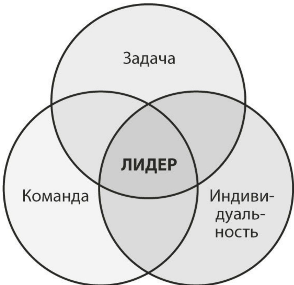
Модель лидерства, ориентированного на действие

Взаимодействие этих трех сфер создает модель команды, неудача в одной области влияет на другие. Например, неспособность выполнить поставленную задачу или отсутствие четко сформулированной приведет к нарушению чувства локтя и снижению уровня индивидуального удовлетворения каждого члена группы.