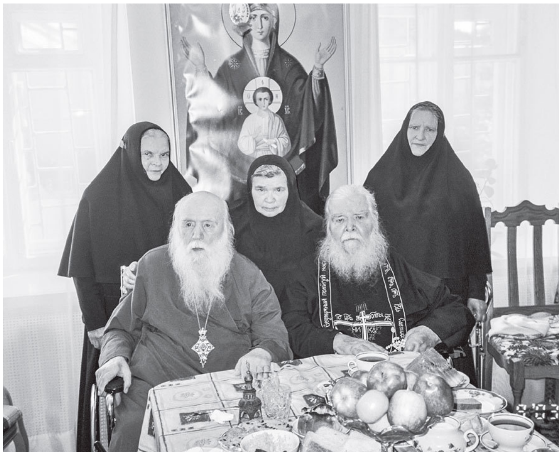
Толгский монастырь, в гостях у владыки Михея

А разве не чудо, что с ним единой семьей более полувека жили монахини?! Они приехали из разных уголков России молодыми девушками. Убедившись в том, что встретили настоящего пастыря и мудрого духовника, остались с ним на всю жизнь. И это сейчас, когда не могут ужиться родственники, когда дети при первой возможности уходят от родителей, когда разваливается половина семей, когда люди, клявшиеся перед алтарем в вечной любви, через полгода начинают ненавидеть своих избранников!