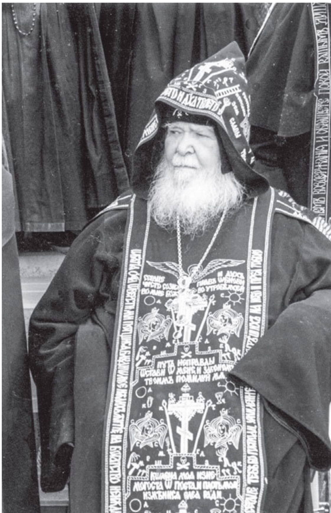
Схиархимандрит Симеон (Нестеренко). 2000-е