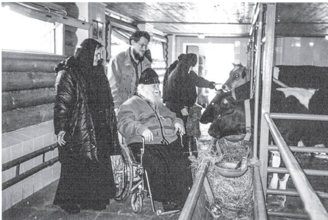
В паломничестве по монастырям

Они легко и радостно поведали мне свою историю. И столько было в них благодарности и любви к батюшке, что я невольно почувствовал его присутствие в этом замечательном доме. Все здесь дышало молитвой и любовью. Мне даже показалось, что я на «подворье батюшкиной пустыньки».