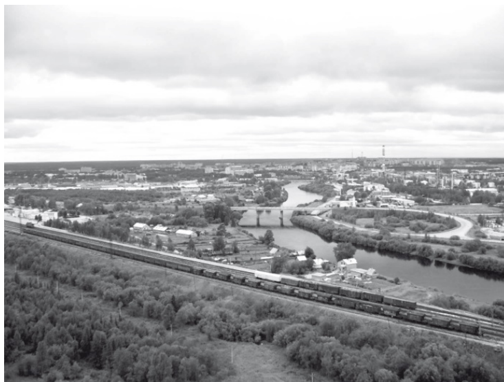
Город Ухта. Вид с горы Ветлосян

На первый взгляд, Ухта, до 1943 года рабочий поселок, – это обычное серое провинциальное местечко, находящееся на севере, но именно здесь когда-то началась первая добыча нефти в России. Население города на сегодняшний день составляет около ста тысяч человек (данные 2016 года), после Сыктывкара это второй по количеству жителей город в Республике Коми.