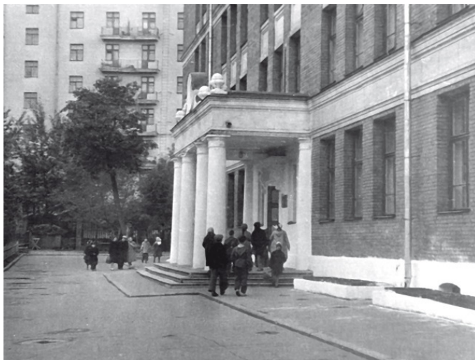
Школа № 232 по адресу: город Москва, Трубная улица, дом 36