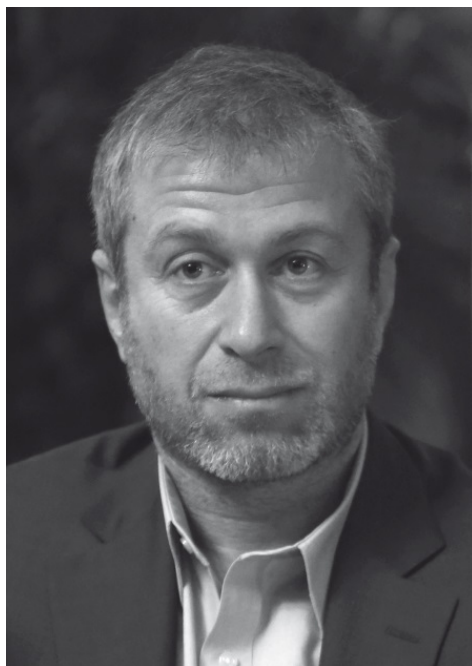
Роман Аркадьевич Абрамович – первый русский миллиардер

Еще в 1999 году ни одна газета, ни один телевизионный канал не имели в своем распоряжении фотографии Абрамовича. Одна газета все же сумела решить эту проблему с помощью денег, посулив награду в 1 миллион рублей за настоящую фотографию влиятельного затворника. Щедрое предложение возымело результат, и размытое изображение Абрамовича вскоре появилось практически во всей российской прессе.