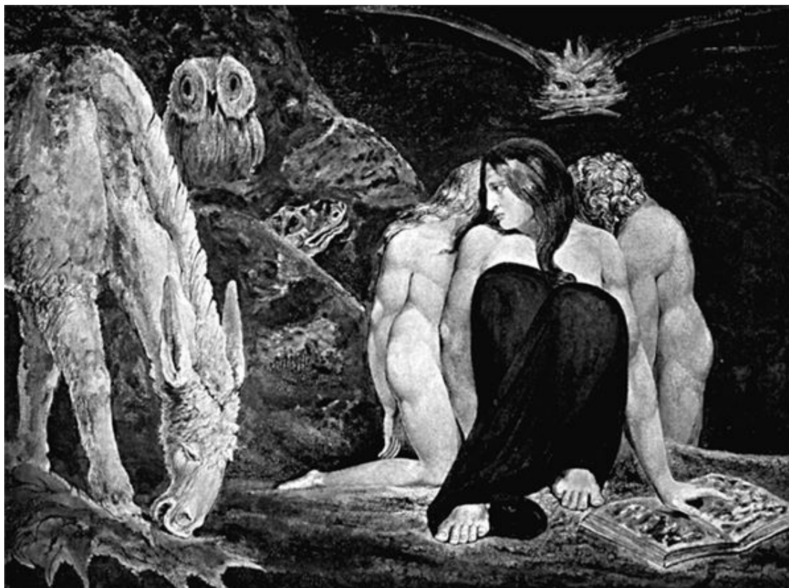
«Геката. Ночь радости Энитармон». Уильям Блейк. 1795 г.

теле-буке»), кледономантия – гадание по случайно сказанному слову. У древних халдеев в ходу были астрология – гадание по звездам, а также экстипиция – предсказание будущего по виду, разного рода изменениям и другим особенностям внутренностей животных. Последнее было в ходу и у магов Китая и Юго-Восточной Азии. Халдеи среди прочего занимались леканомантией – наблюдением за маслом на воде. Происходило это так: жрец наливал несколько капель масла в чашу, наполненную водой, и изучал затем, какую форму примет масло на поверхности воды, растечется и создаст некую форму или останется в виде сплошной массы. В более поздние времена появилось очень похожее гадание на кофейной гуще.