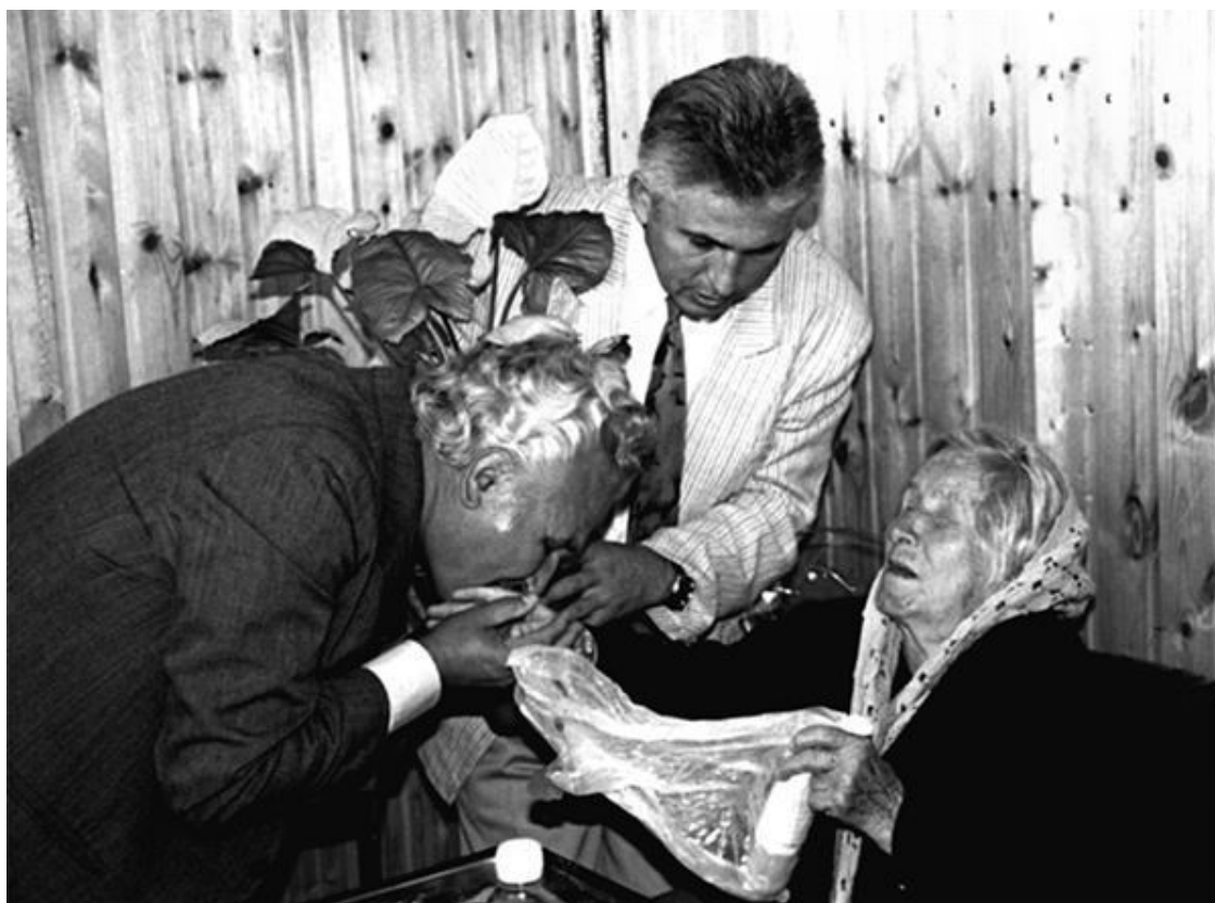
Вангу, живущую в Рупите, поздравляют с днем рождения. 1994 г.

ным человеком, чьи сверхспособности были официально признаны правительством. Немногим дается дар предсказывать будущее с такой точностью, а ведь Ванга знала даже дату своей смерти! До конца не понятно, откуда Вангелия знала о том, что случится по прошествии длительного времени. Объясняют это не иначе, как даром Божьим, да и вряд ли найдется иное, более распространенное толкование феномену. Хотя находились(и находятся) те, кто считает ее дар всего лишь угадыванием, граничащем с интуицией. Но стоит упомянуть, что для древних греков и индийцев интуиция означала нечто большее, чем подразумеваем мы под этим понятием.